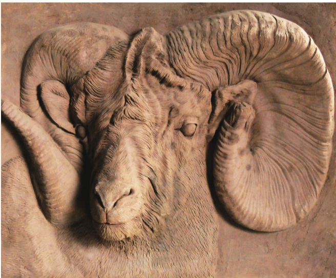
树脂浮雕作品《生肖羊》。