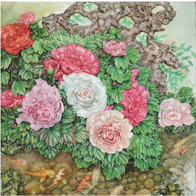
油泥浮雕作品《富贵有余》。