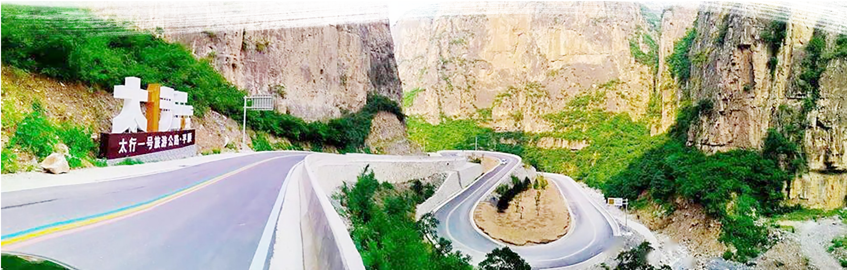
旅游公路犹如一条巨龙盘旋在山中。

去往太行山大峡谷景区的交通拥堵问题,该项目不仅辐射带动周边旅游业发展,而且有效杜绝旅游道路交通安全问题,进一步夯实交通运输基础设施建设,提升全县旅游交通的通行能力和安全性,为旅游业和交通运输业的可持续发展奠定坚实基础。