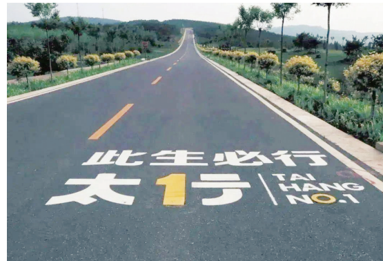
太行一号旅游公路,平整、干净、整洁,已成为网红打卡地。

去往太行山大峡谷景区的交通拥堵问题,该项目不仅辐射带动周边旅游业发展,而且有效杜绝旅游道路交通安全问题,进一步夯实交通运输基础设施建设,提升全县旅游交通的通行能力和安全性,为旅游业和交通运输业的可持续发展奠定坚实基础。