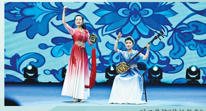
对口单弦《体坛新曲》