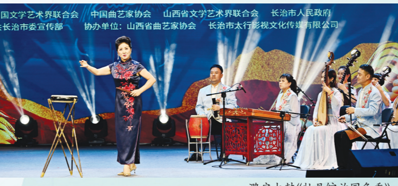
潞安大鼓《牡丹绽放国色香》