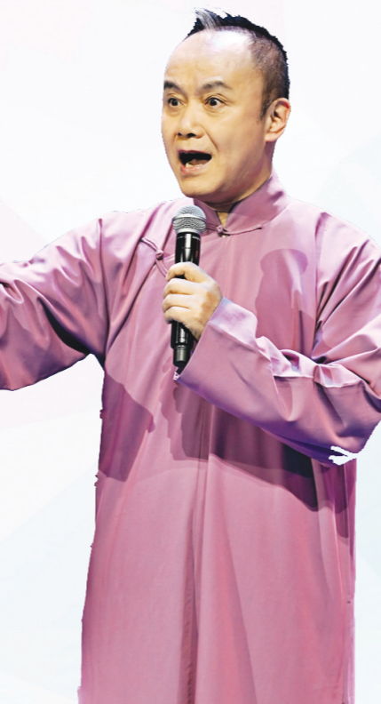
京韵大鼓《重整河山待后生》