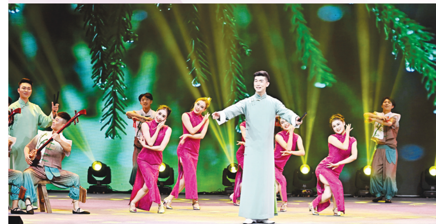
鼓曲联唱《二十四节气》