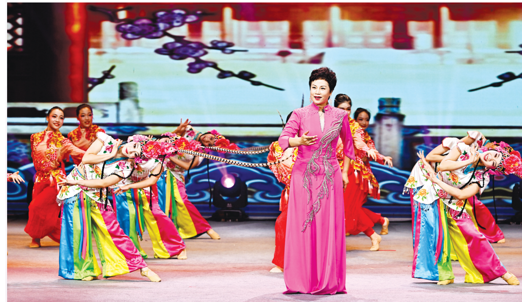
古曲联唱《古曲新韵牡丹颂》