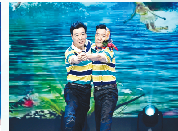
幽默小品《小鸟与蜜蜂》