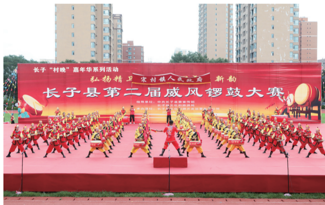
长子县第二届乡村威风锣鼓大赛现场。

本报讯 8月3日,长子县第二届乡村威风锣鼓大赛在长子一中南校区精彩开锣,来自全县各乡镇11支锣鼓表演队同台竞技、锣鼓争锋,为广大群众送上了一场气势恢宏、酣畅淋漓的锣鼓表演盛宴。