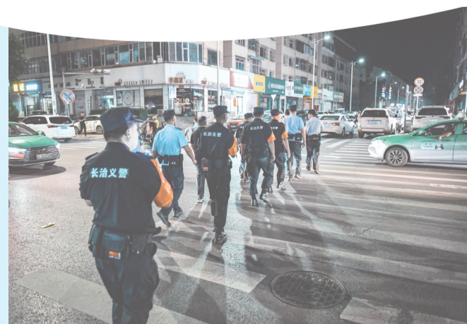
加大巡逻防控力度。