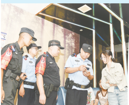
对棋牌游艺、酒店旅馆等场所开展地毯式巡查。