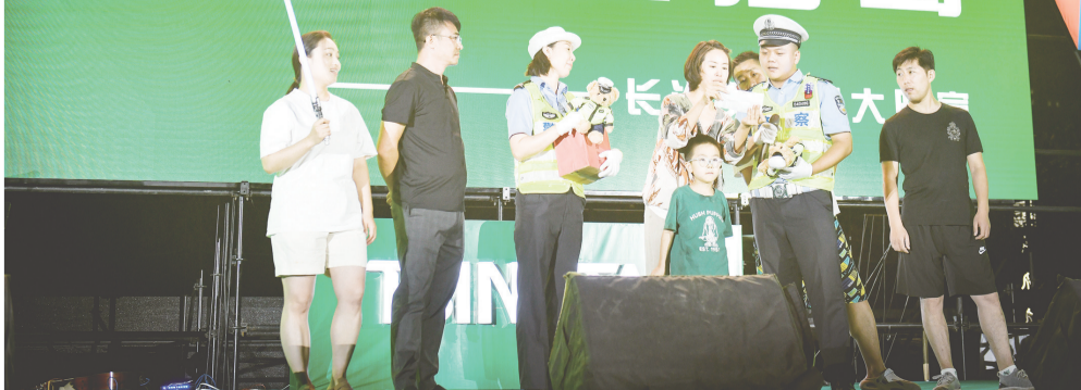
做好安全防范宣传。