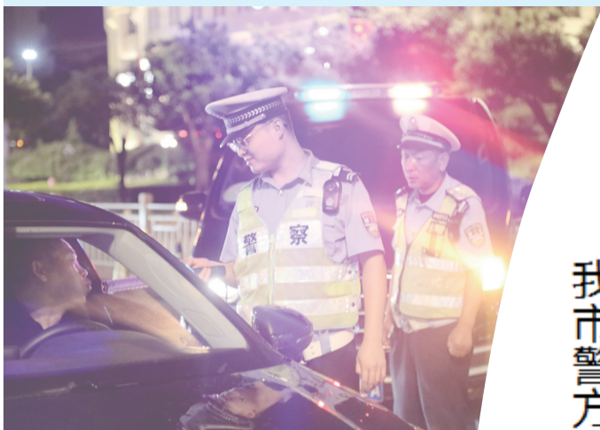
严查酒驾、醉驾等交通违法行为。