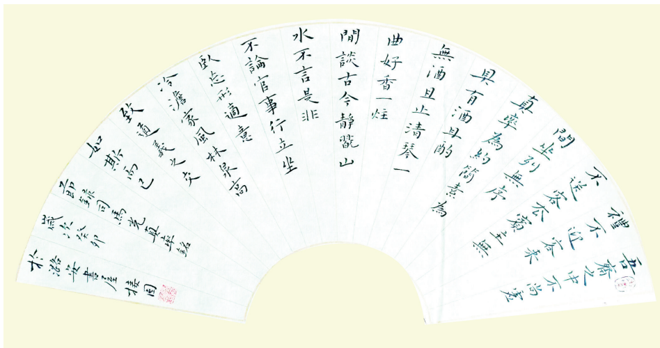
司马光《真率铭》楷书扇面