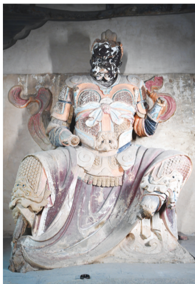
栩栩如生天王造像。