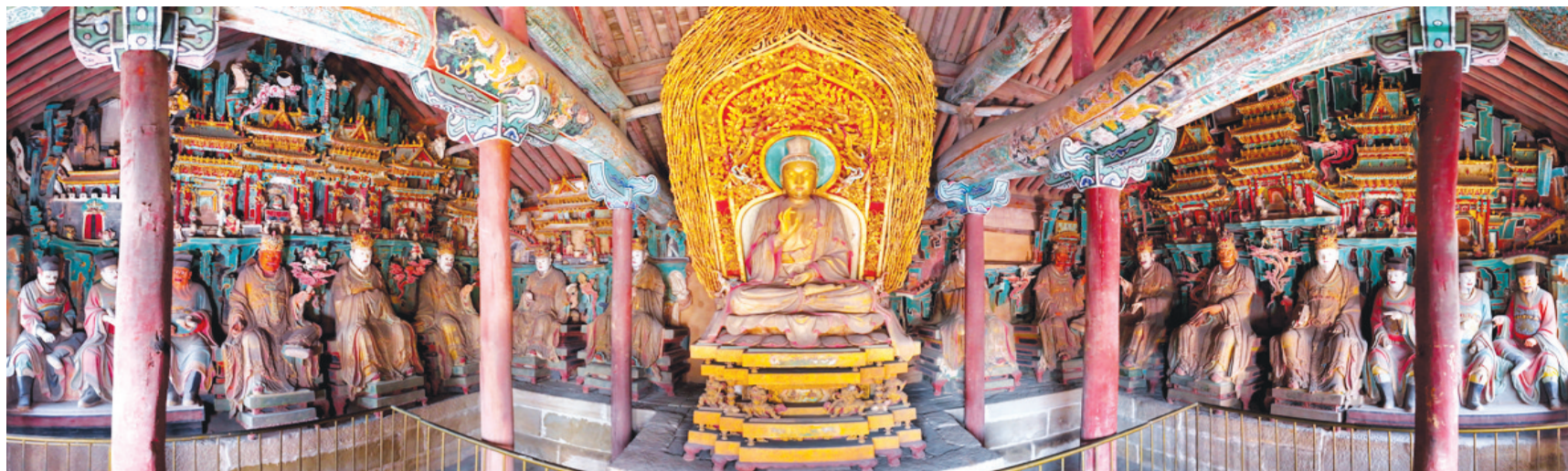
独具艺术特色的十帝殿人物造像。