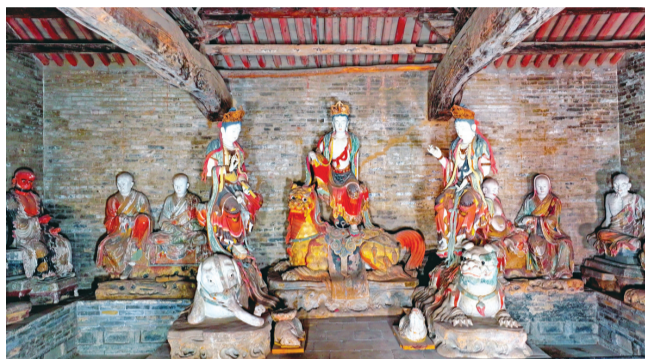
菩萨秀美，罗汉生动。

崇庆寺内留存宋明彩塑达200余尊，西侧三大士殿内的宋代塑像最为精彩，殿内正中为身在坐骑上的观音、文殊、普贤三位大士，与周边彩塑十八罗汉像相呼应，菩萨秀美，罗汉生动，刚柔并济，华丽无比。其中，十八罗汉造像出自北宋元丰二年（1079年），是已知最早有确切纪年的十八罗汉造像，匠人们结合现实中僧人的形象，发挥想象力，塑造出了世俗化、生活化的罗汉形象，前国家画院雕塑院院长钱绍武先生誉之为“宋塑之冠”。