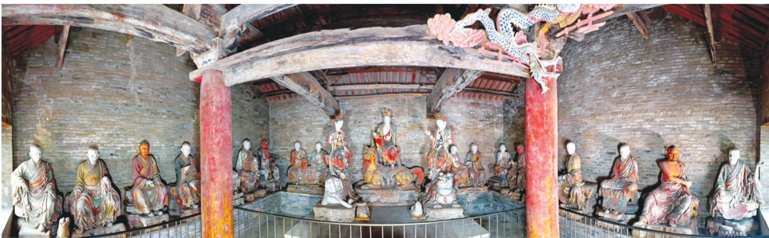
“彩塑之冠”十八罗汉彩塑。