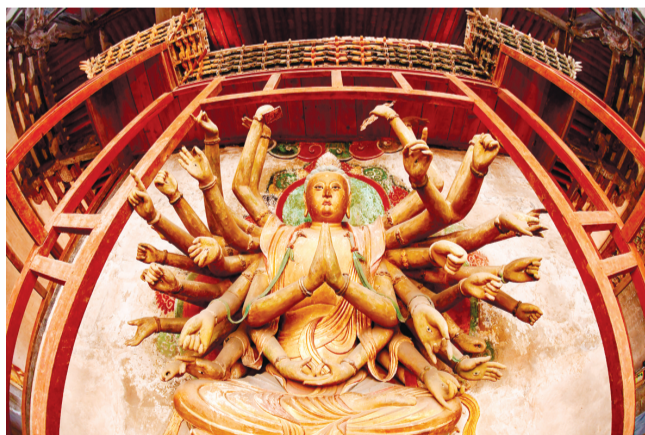
造型别致的观音像。