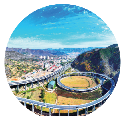
交通路网提档升级。