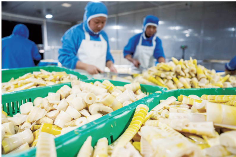
11月27日,工人在桃江县马迹塘镇笋竹特色产业园内一家鲜笋加工企业生产车间加工鲜笋。

今年以来,京津冀三地人社部门围绕职业能力建设举办多场联席活动,共享技能培训公共服务资源,构建三地职业技能培训一体化平台;整合三地专家资源,打造京津冀高技能人才队伍建设专家库;成立京津冀技工教育联盟,推进三地技工教育创新升级;联合举办京津冀职业技能大赛,发现、培养服务京津冀区域经济发展的优秀高技能人才。