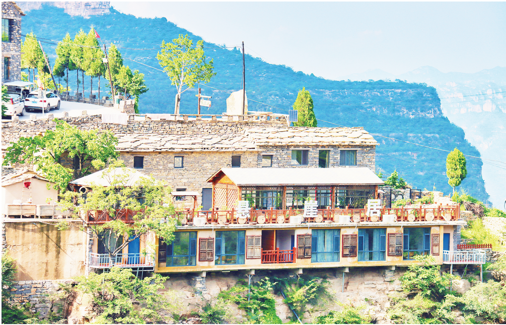
临山而建的悬崖居成为一道独特的风景。

12月17日,北京日报刊发了《悬崖居:叫响长治高端民宿品牌》一文,对我市平顺县石城镇岳家寨悬崖居再次被评为国家乙级旅游民宿的消息进行了报道,充分展现了岳家寨丰富的石头文化和农文旅融合带来的新变化。今日本报特转发此文,以飨读者。