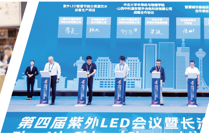
8号: 密集举办系列高规格产业发展主题活动,城市活力进一步彰显。