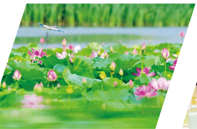
15号: 长治入选国家深化气候适应型城市建设试点名单,良好环境擦亮生态长治金字招牌。