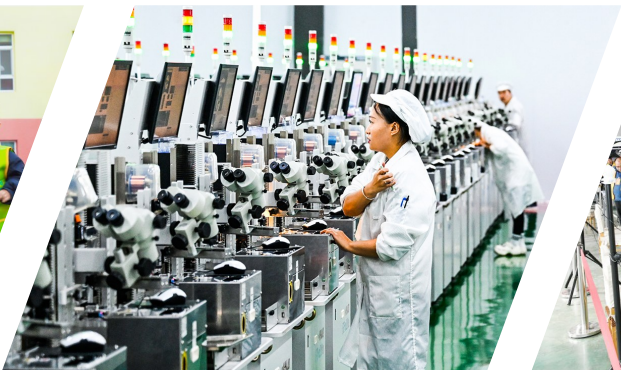
17号: 长治市数字经济协会成立,培育壮大数字经济、加快建设数字长治再添硬举措。