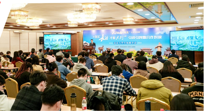
20号: “中国人才夏宫”品牌凸显,人才生态提档升级,人才支撑高质量发展的作用不断显现。