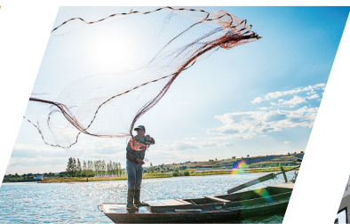
13号: 学习运用“千万工程”经验,加快建设彰显太行山水风韵、宜居宜业和美乡村,城乡融合发展呈现新气象。