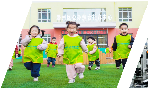
4号: 深入实施全国普惠托育示范项目,打造长治“幼有善育”示范名片,提高“一老一小”幸福感和满意度。