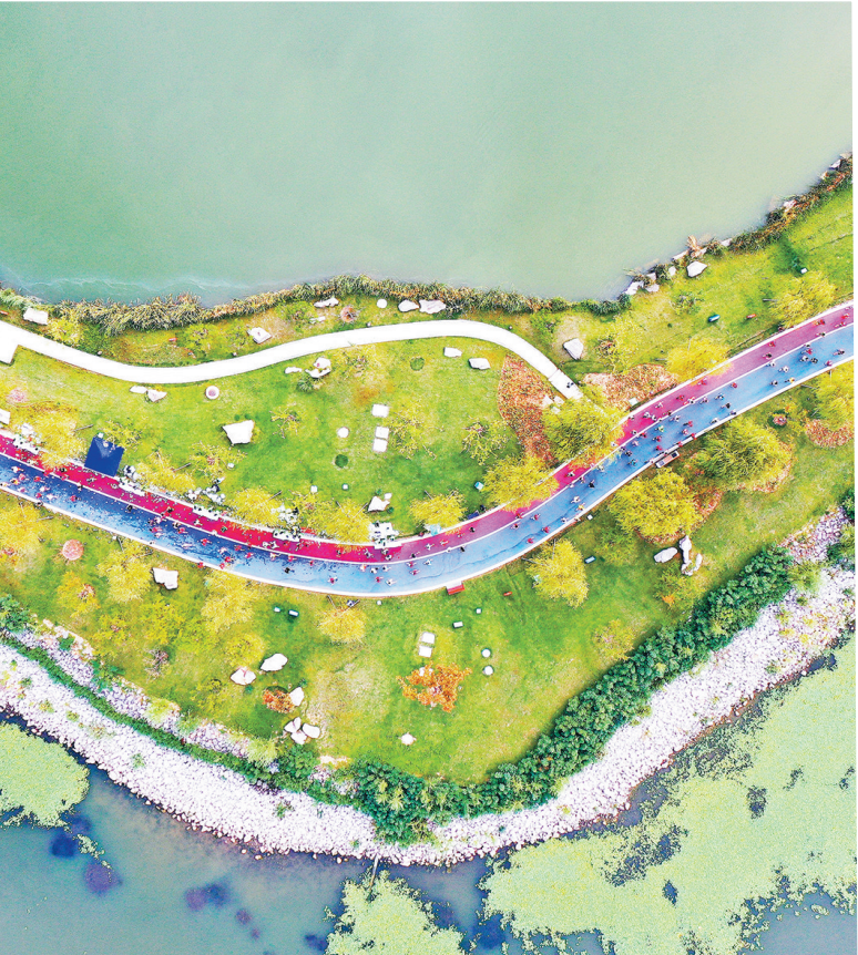
18号: 2024 长治环漳湖马拉松赛激情开跑,体育市场消费活力奔涌,以景引赛、以赛促消费塑造消费新场景。