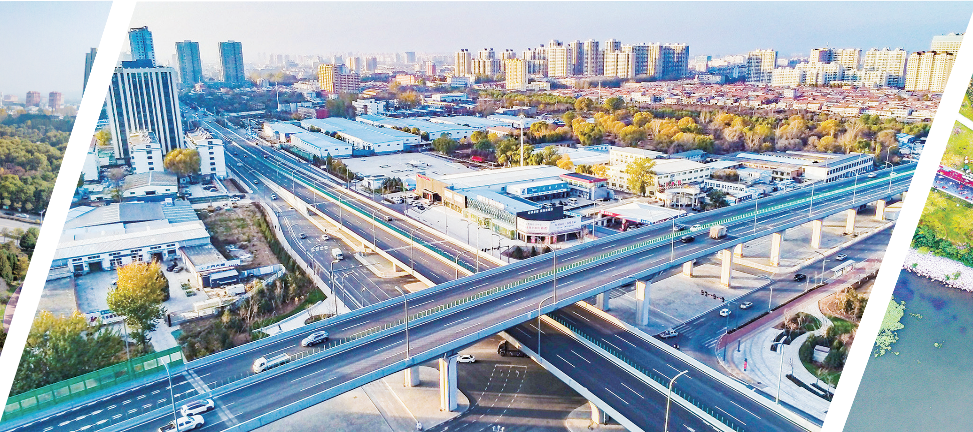
11号: 东南外环快速通道实现全线贯通,城市内循环进一步畅通,区域大通道进一步拓展。