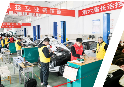
19号: 第六届长治技能大赛成功举办,“技能长治”建设蹄疾步稳,高质量充分就业取得新成效。