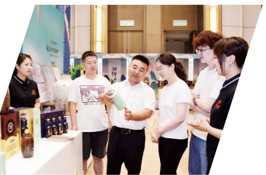
16号: “浊漳清酿 古韵悠长”长治白酒区域文化品牌正式发布,大力实施“品牌强市”战略,千年潞酒在新时代焕发新光彩。