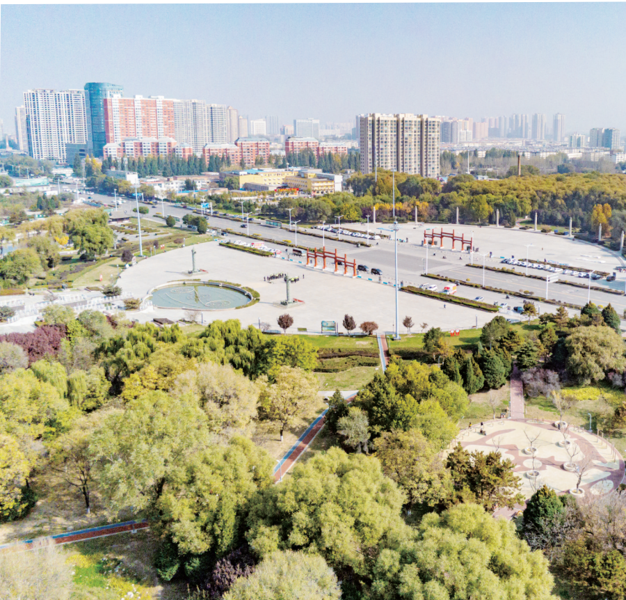
6号: 海绵城市建设工作连续3年获评A档,在全国首批系统化全域推进海绵城市建设中作出示范。