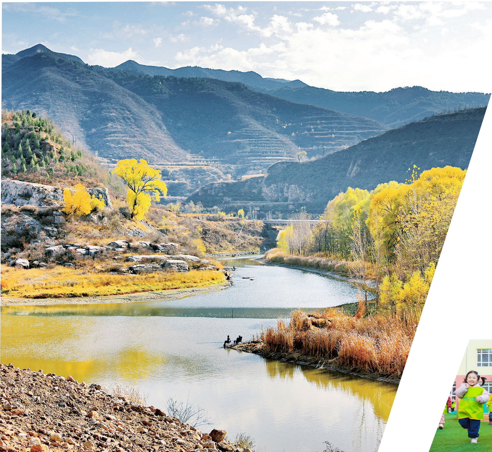
5号: 我市成功入选第二批全国市级水网先导区,八百里浊漳水生态保护与高质量发展深入推进。