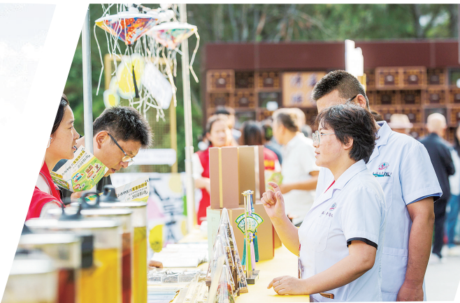
7号: 扎实推进首批国家中医药传承创新发展展示试点,着力建设中医药强市,群众看病就医获得感持续提高。