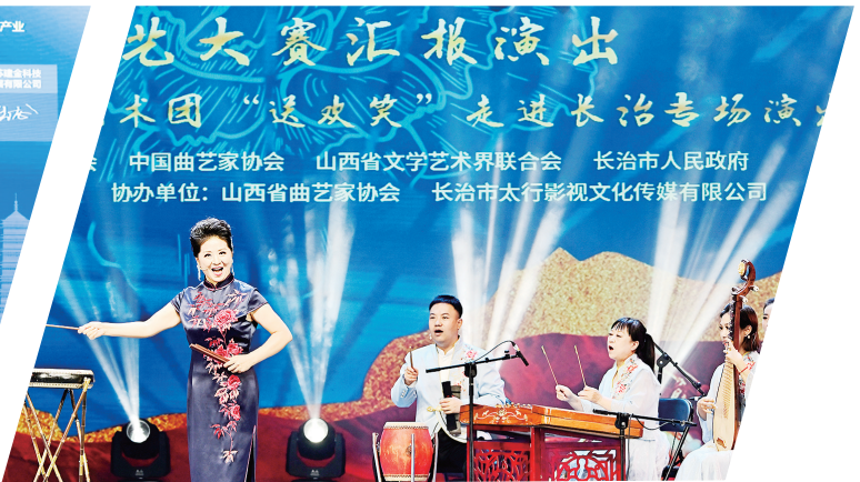
9号: 系列文化活动精彩纷呈,文旅康养产业活力澎湃,城市美誉度、文化影响力大幅提升。