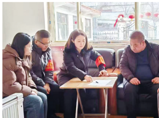
今年以来,平顺县以开展“重大项目建设年”活动为契机,强化各级各部门项目谋划、招引、推进,切实以项目建设推动高质量发展。图为2月26日平顺县苗庄镇乡村两级干部积极谋划产业项目。