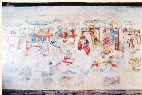
古代生活场景的壁画