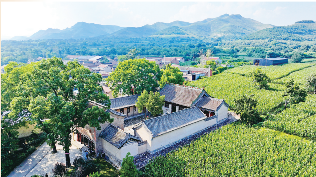
辛村天齐王庙鸟瞰