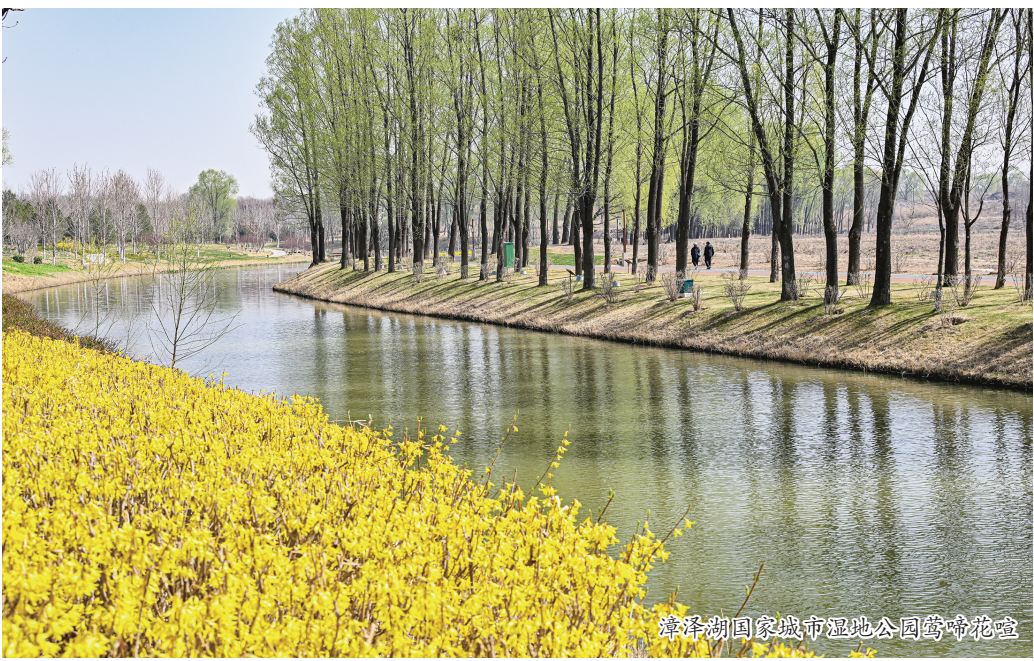
漳泽湖国家城市湿地公园药神花堂