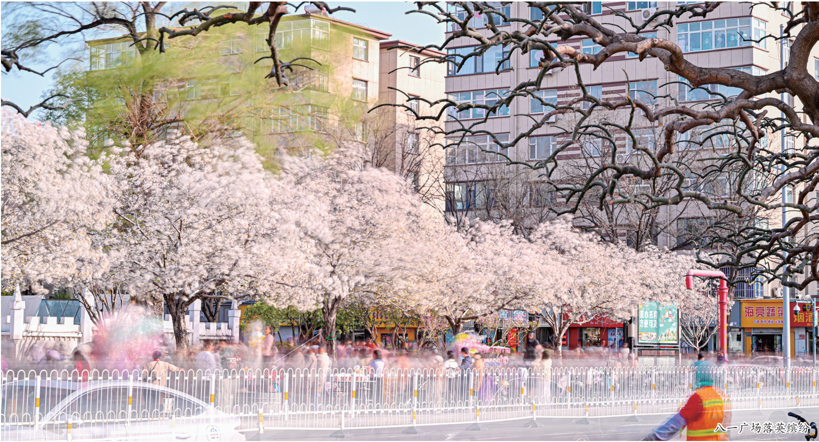
八一广场落英缤纷