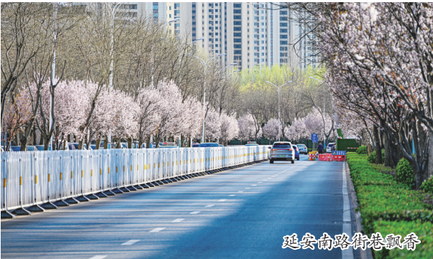
延安南路街巷飘香