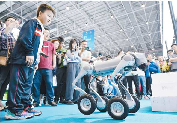
4月16日,观众在消博会现场观看国产机器狗展示技能。

在第五届中国国际消费品博览会上,全国30多个省市区携国货精品参展。从非遗技艺到科技潮品,国货产品通过传承与创新引领消费新潮流,向世界展示了中国品牌的魅力,为中国经济的持续发展和消费市场的繁荣注入新活力。