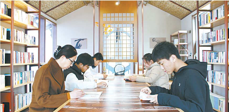
现代时尚的城市书屋吸引了众多读者前来读书。