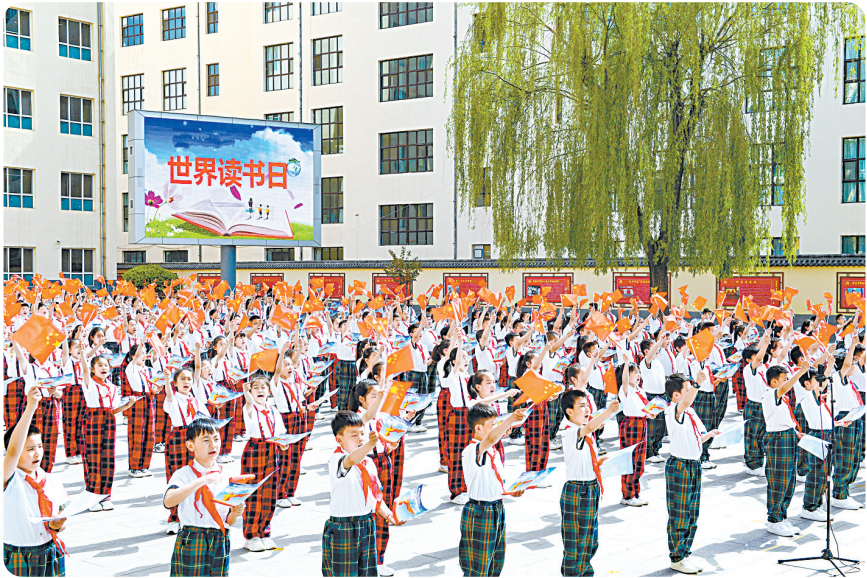
我市书香氛围日益浓厚，全民阅读蔚然成风。

文化长治，书香氤氲。书承文脉，香满家园。 从打卡“最美书店”到参加线上阅读活动，从社区书屋的便民服务到公共图书馆的智慧升级，从校园晨读的朗朗童声到数字阅读的互动体验……放眼长治大地，书香氛围日益浓厚，全民阅读蔚然成风。 近年来，我市加快推进全民阅读，建设书香长治，通过构建全域阅读生态、创新阅读服务模式、丰富阅读实践活动，培育全民阅读品牌，吸引全社会参与到阅读中来，形成爱读书、读好书、善读书的浓厚氛围，为推动全市经济社会高质量发展厚植文化底蕴、凝聚精神力量。