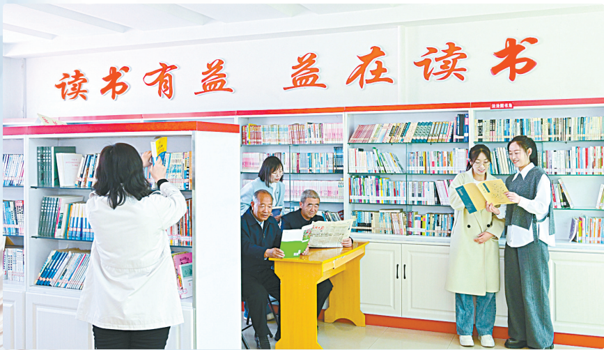
农家书屋成为农村群众的精神粮仓”。

聚焦不同阅读群体需求，我市积极寻求、主动贴近广大读者的兴趣点和关注点，不断丰富阅读的内容、载体和形式，创新阅读推广方式，深入开展内容丰富、形式多样的阅读活动，一大批接地气、具新意、有特色的读书活动持续举办，不断掀起全民阅读热潮，极大满足人民群众高品质的阅读需求。