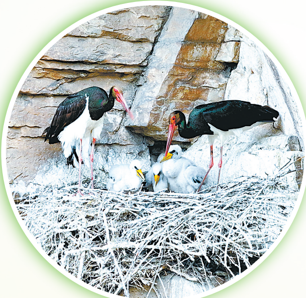
黑鹳,国家一级保护动物。身披黑绸羽衣,腹衬雪白内衬,红唇长腿是它的时尚标志。常年在山西的河流湿地漫步。