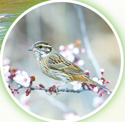
↑ 黄眉鹀,国家三有保护动物。眉毛自带“土豪金”美颜,“黄马甲”“黑领带”尽显时尚风采。