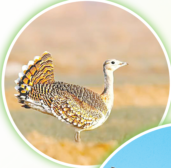
← 大鸨,国家一级保护动物。身披灰褐羽衣,头戴浅纹“礼帽”,是草原上的独特风景。如今,栖息在山西的旷野农田。