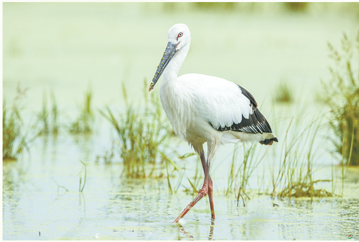
东方白鹤,国家一级保护动物。白衣黑翅配红腿长喙,是三漳湿地的“优雅渔夫”,专捕鱼虾螺蚌,迁徙万里只恋山西净水。