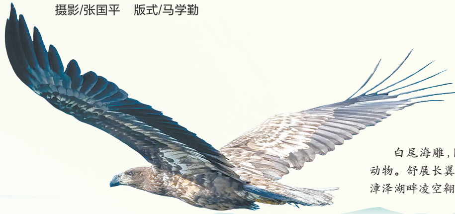
白尾海雕,国家一级保护动物。舒展长翼,雪尾似旗,在漳泽湖畔凌空翱翔。