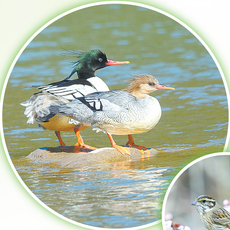
中华秋沙鸭,国家一级保护动物。头戴凤冠,羽披鳞纹,是长治碧波间的“水墨舞者”。