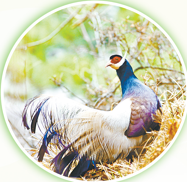
褐马鸡,山西的“山林卫士”,国家一级保护动物。身披褐羽铠甲,红颊似火,白尾如旗,漫步在长治的太行秘境。