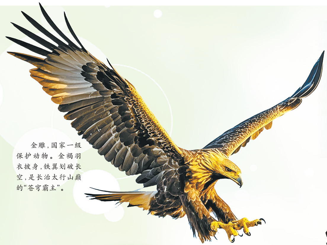
金雕,国家一级保护动物。金褐羽衣披身,铁翼划破长空,是长治太行山巅的“苍穹霸主”。