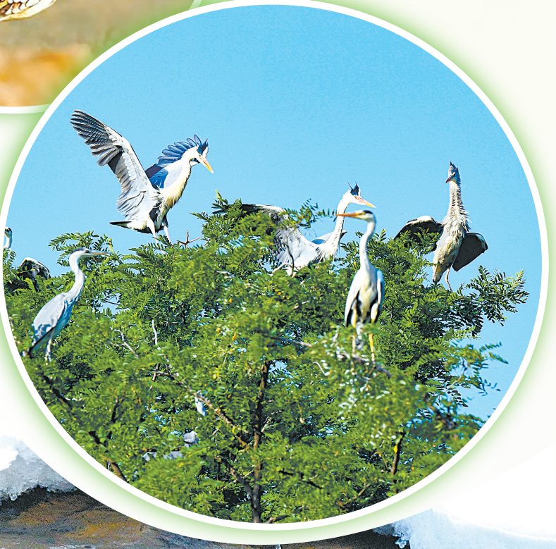
苍鹭,国家三有保护动物。羽毛自带高级灰滤镜,最爱金鸡独立,是靠实力吃饭的“捕鱼达人”。