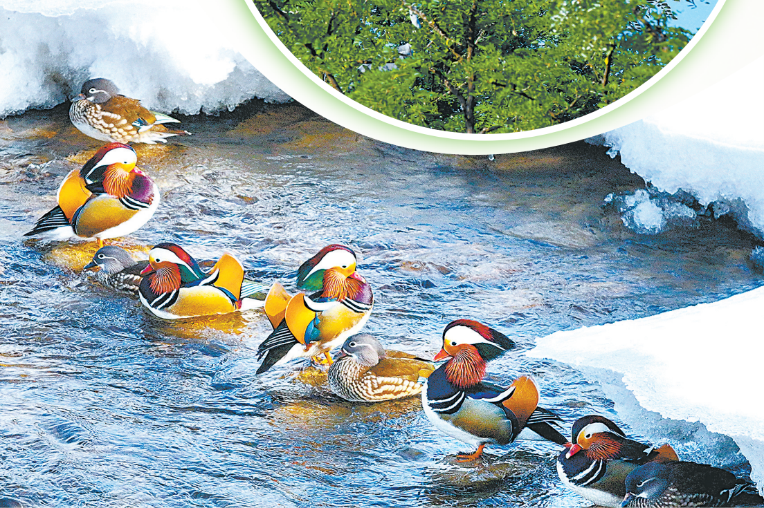
鸳鸯,国家二级保护动物。身着彩裳,自由惬意。