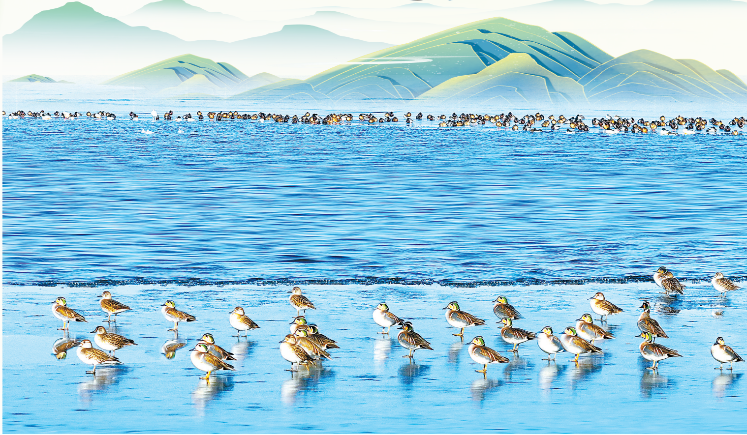
花脸鸭,国家二级保护动物。因脸上酷似京剧花脸脸谱而得名,自带彩妆,泳姿妖娆。