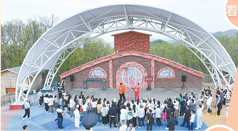
仙堂山景区推出“山水+人文+创意”多元游法。