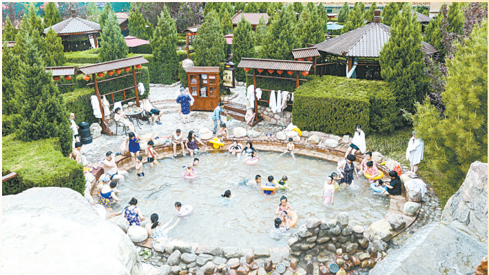
壶山温泉成游客康养度假热门目的地。