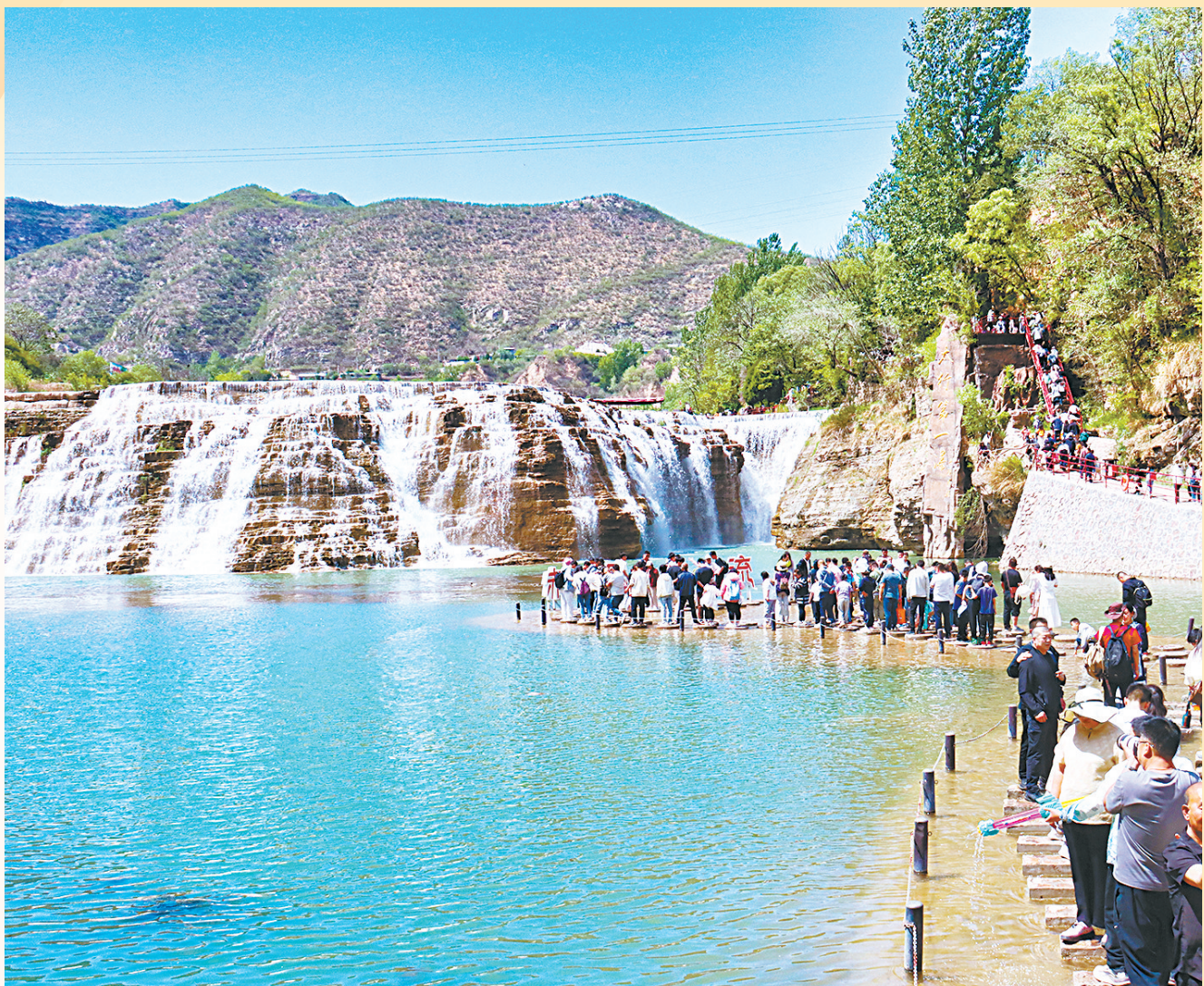
赤壁悬流景区将“流量”化为“留量”，以服务留住游客。