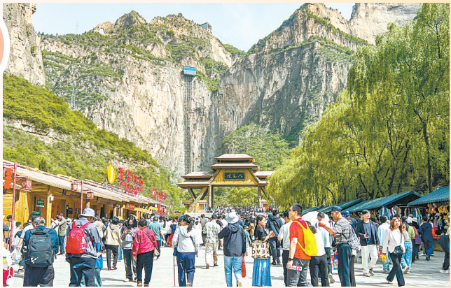
太行山大峡谷八泉峡景区游人如织，热闹非凡。