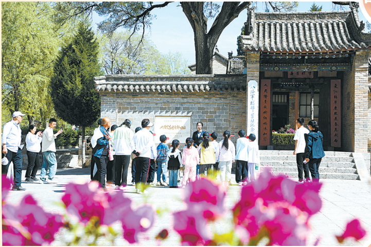
“五一”假期，武乡红色旅游受青睐。