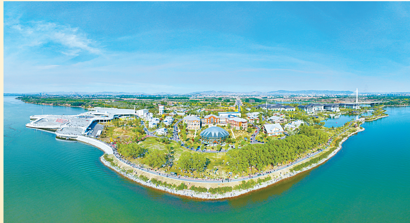
漳泽湖国家城市湿地公园，让广大游客感受自然与人文交织的生态之美。