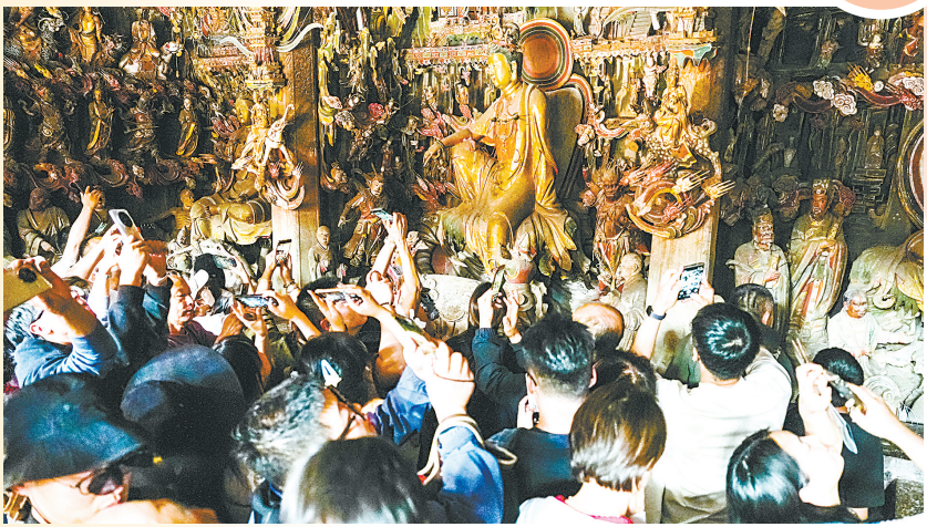
观音堂景区人气持续“升温”。