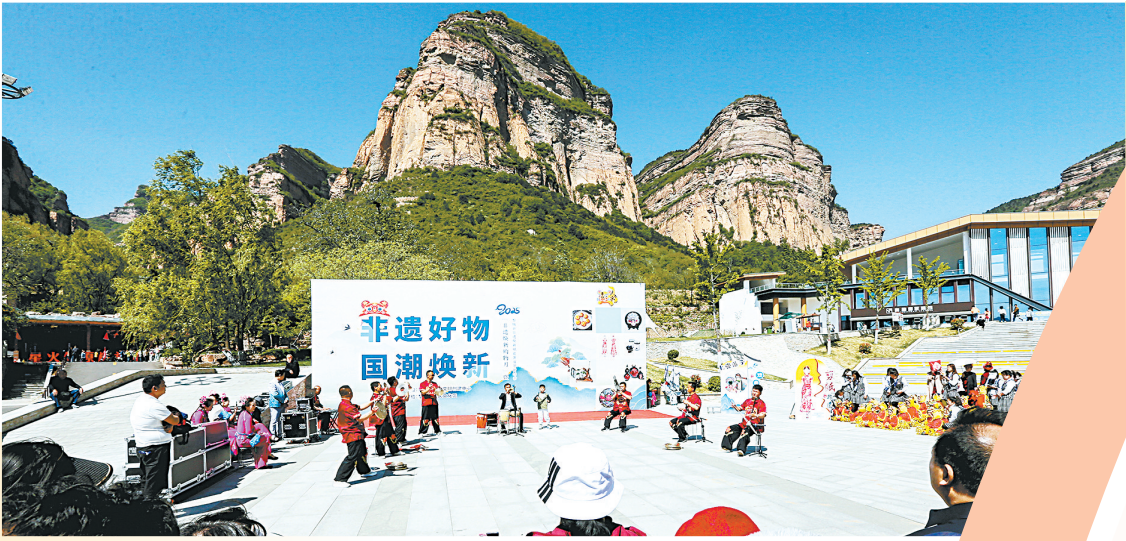
黄崖洞文化旅游区推出“非遗好物 国潮焕新”主题特色活动。