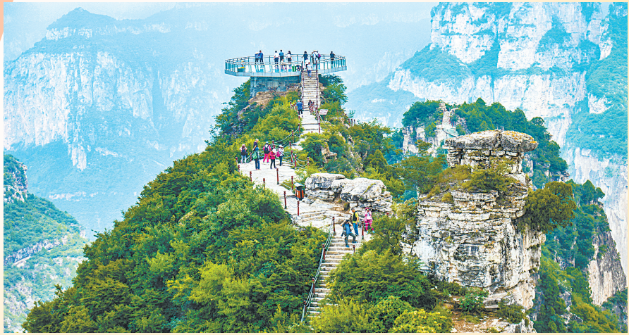
通天峡景区多彩的文旅活动，将太行山水之韵、人文之美转化为消费动能。