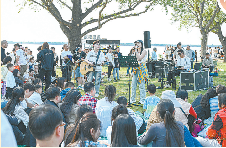
湖畔草坪音乐，搭建起市民与艺术的桥梁。