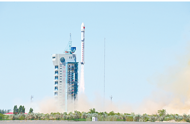
5月14日12时12分，我国在酒泉卫星发射中心使用长征二号丁运载火箭，成功将太空计算卫星星座发射升空，卫星顺利进入预定轨道，发射任务获得圆满成功。