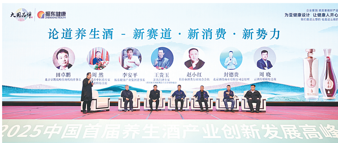
高峰论坛共话产业新机遇