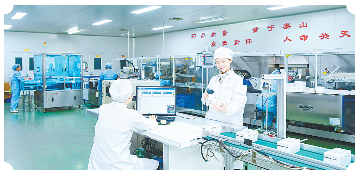
智能化生产车间高速运转