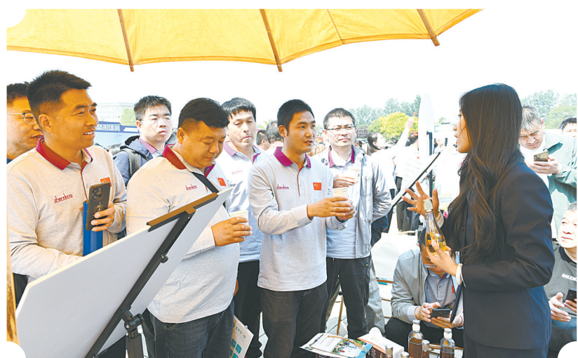
养生酒保健功效多

5月10日，初夏的八一广场人潮涌动，一场由山西振东健康产业集团有限公司主办的公益义诊暨新品发布会在此举行。 活动现场，来自长治医学院附属和平医院、长治医学院附属和济医院、市中医院研究所附属医院的多位专家开展义诊活动，涵盖老年病、消化、名中医治未病等多个科室，为市民提供免费问诊、健康咨询等服务。振东集团设立产品发放区，系列健康产品同步亮相。这场融合公益与创新的活动中，不仅展现了振东集团深耕大健康产业的决心，更彰显了其“与民同富、与家同兴、与国同强”的核心价值观。作为山西省首家创业板上市企业，振东集团以科技赋能、慈善为基、人才为翼，正以蓬勃之势引领我市健康产业高质量发展。