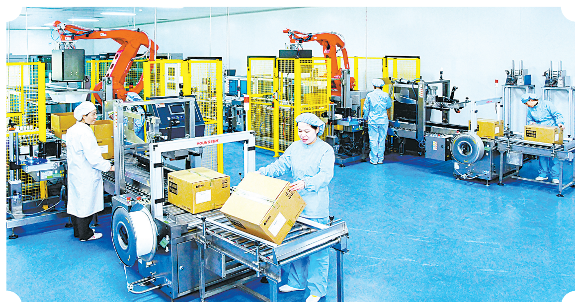
全自动包装生产效率