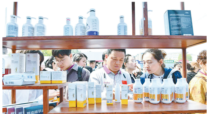
健康护理产品受青睐