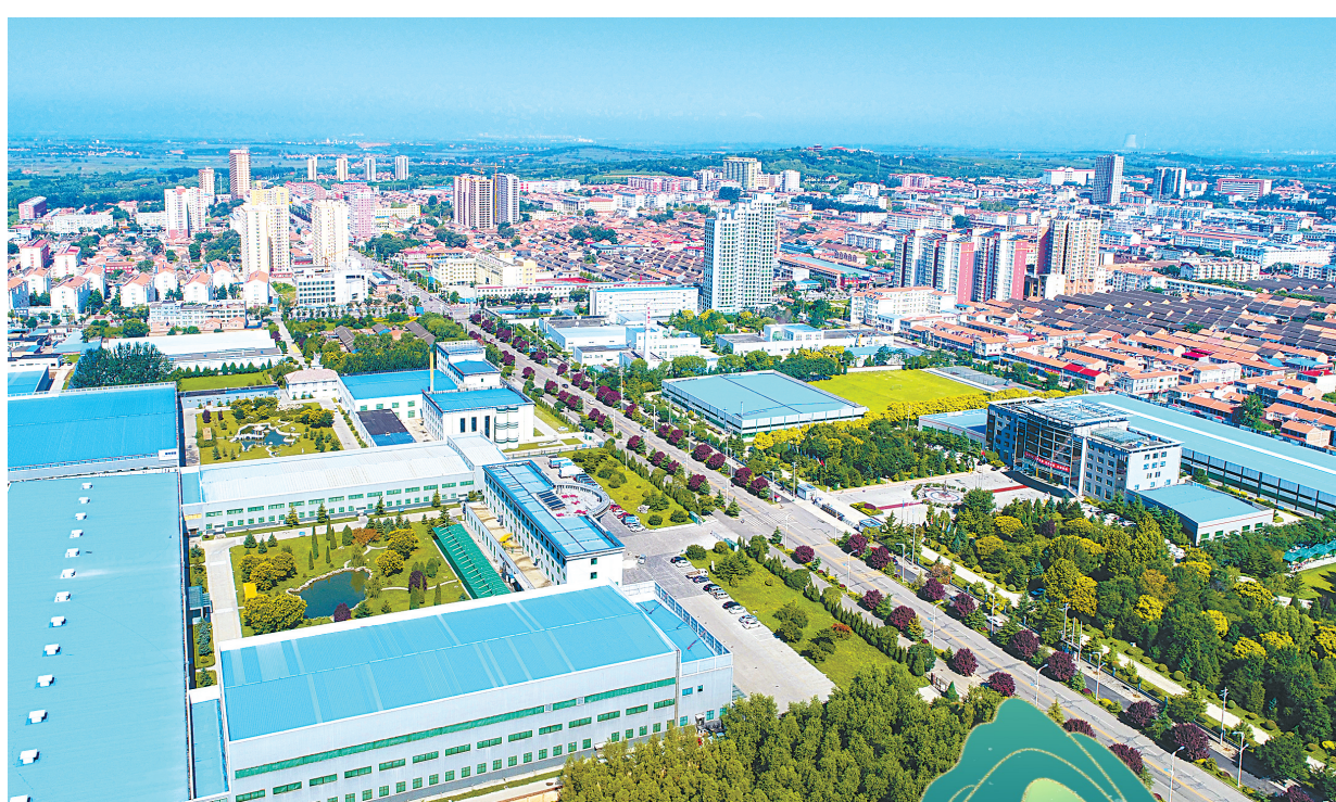
振东科技园鸟瞰图