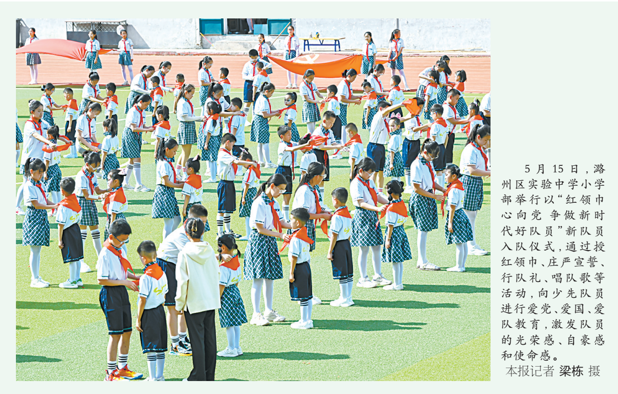
5月15日,潞州区实验中学小学部举行以“红领巾争做新时代好队员”新队员入队仪式,通过授红领巾、庄严宣誓、行队礼、唱队歌等活动,向少先队员们进行爱党、爱国、爱队教育,激发队员的光荣感、自豪感和使命感。

市邮政管理局负责人介绍,将持续深化“三张网”建设,推动文明交通管理从集中整治向常态长效转变,以更优的交通秩序、更高的服务质量,为行业高质量发展和城市文明建设贡献力量。