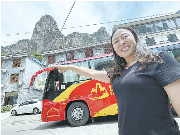
沿线景区民宿、餐饮客流量持续增长。