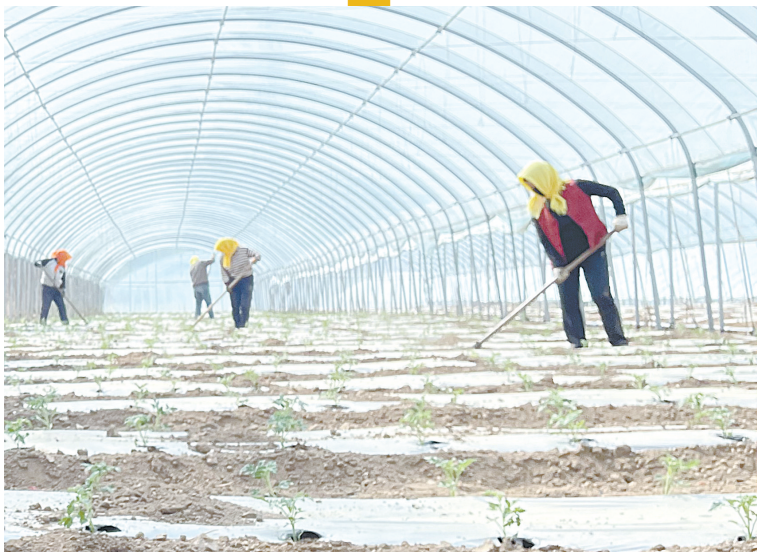
太行一号旅游公路带动特色产业发展,为乡村振兴注入强劲动能。