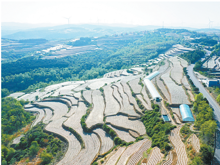
层层叠叠的梯田,在阳光照耀下熠熠生辉。