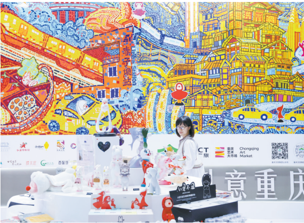
5月22日,观众在文博会重庆展台了解文创产品。当日,为期5天的第二十一届中国(深圳)国际文化产业博览交易会在深圳国际会展中心开幕。本届文博会共设8大展馆,包括3个综合馆和5个专业馆,共有6280家政府组团、文化机构和企业线上线下参展。