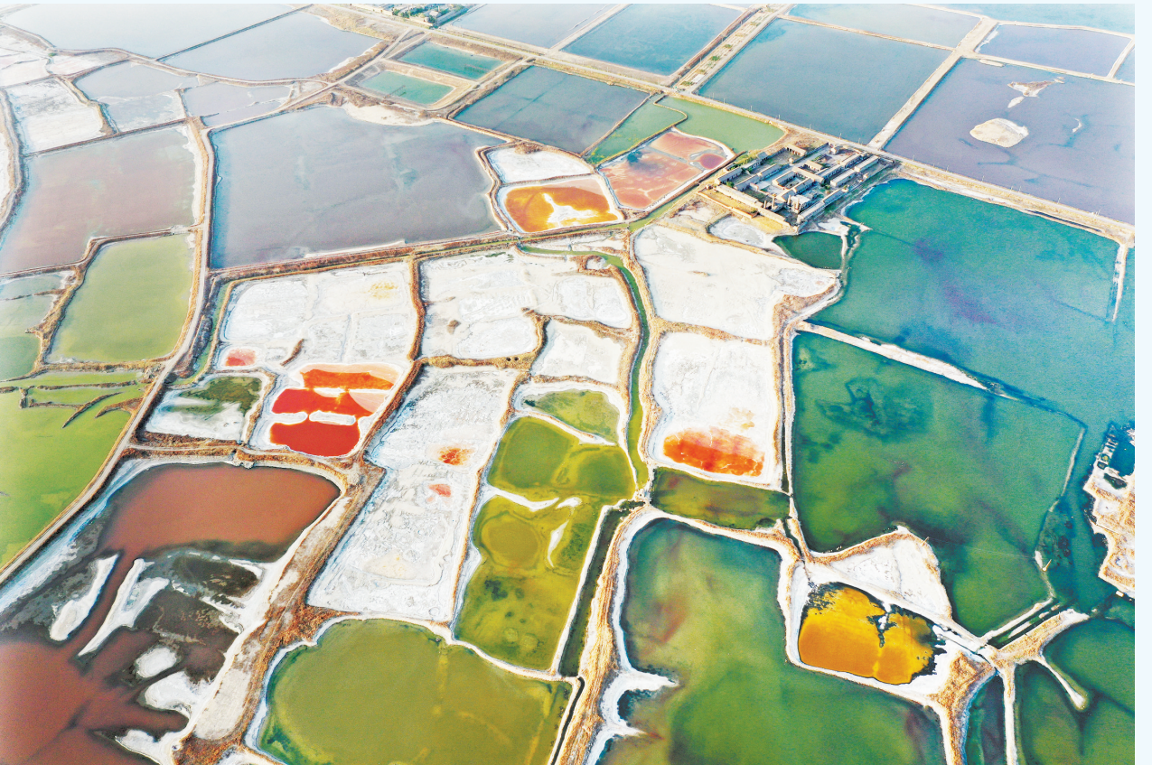
连日来,随着气温持续升高,位于山西南部的运城盐湖呈现出色彩斑斓的景象,从空中俯瞰,如同一块块散落在大地上的调色盘。图为5月20日拍摄的运城盐湖景色(无人机照片)。