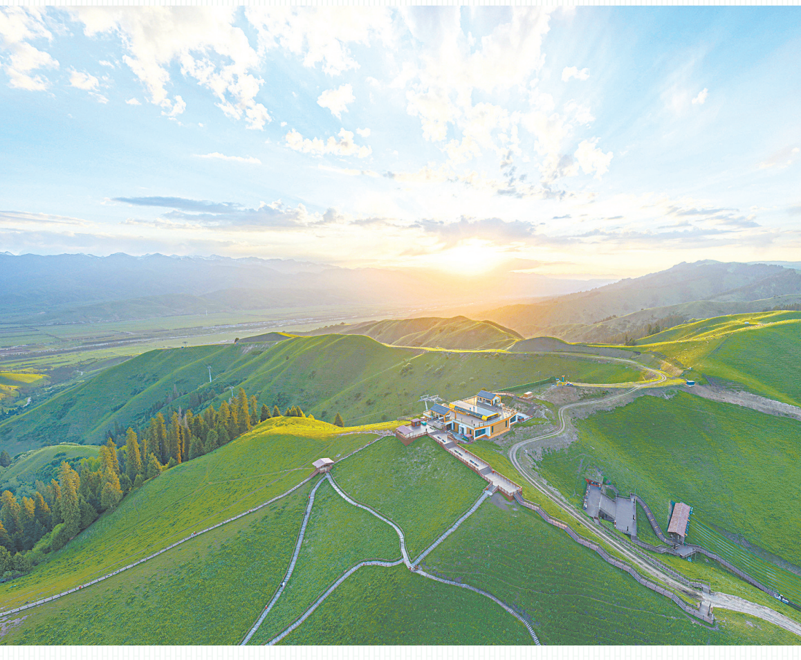
5月23日拍摄的晨光中的那拉提草原（无人机全景照片）。位于天山怀抱伊犁河谷之中的那拉提草原绿意盎然，迎来一年中的“最美时刻”。