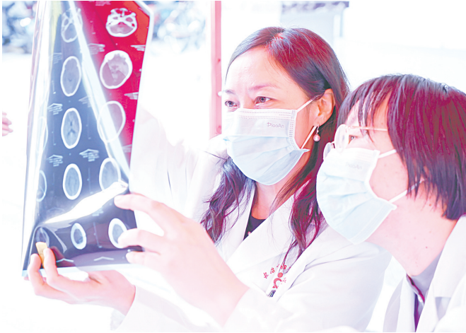
义诊活动中为患者分析病情

韩彤立介绍，市妇幼保健院今后将更加致力于提升儿童重大疾病及急危重症的治疗能力，并不断优化医疗资