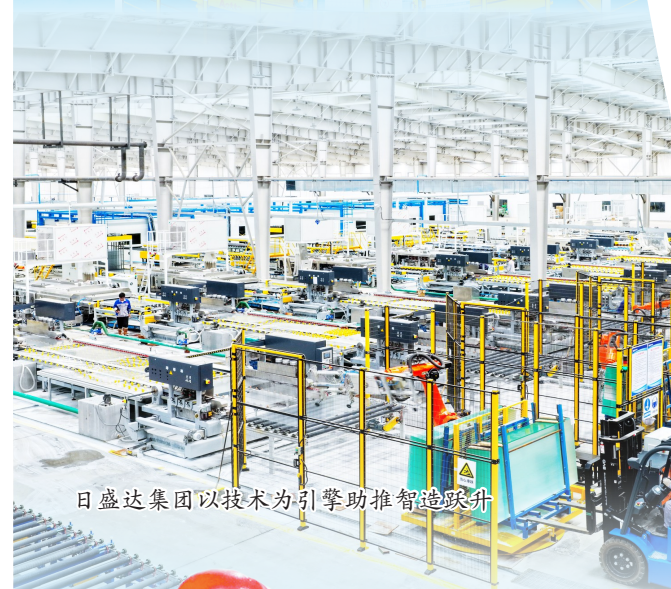
日盛达集团以技术为引擎助推智造跃升