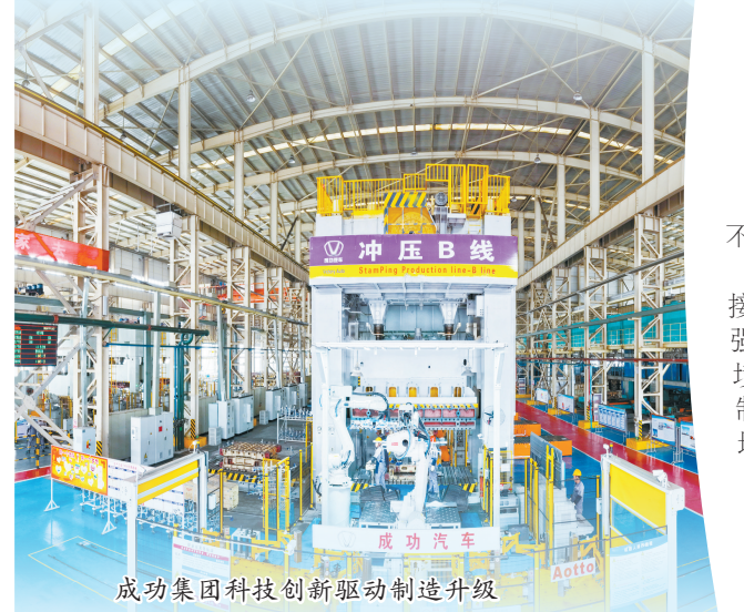
成功集团科技创新驱动制造升级