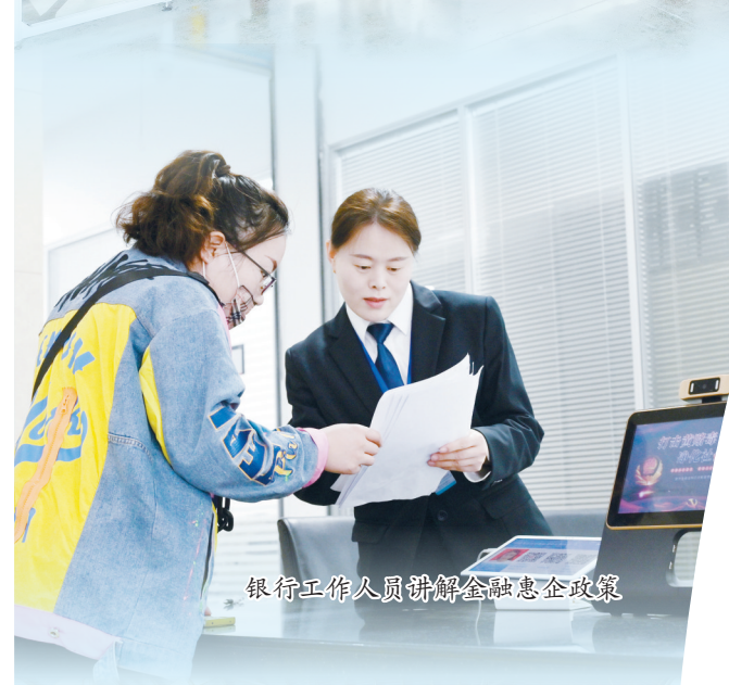
银行工作人员讲解金融惠企政策