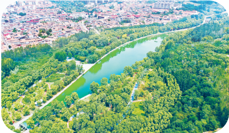
黎城县翠林环抱生态宜人