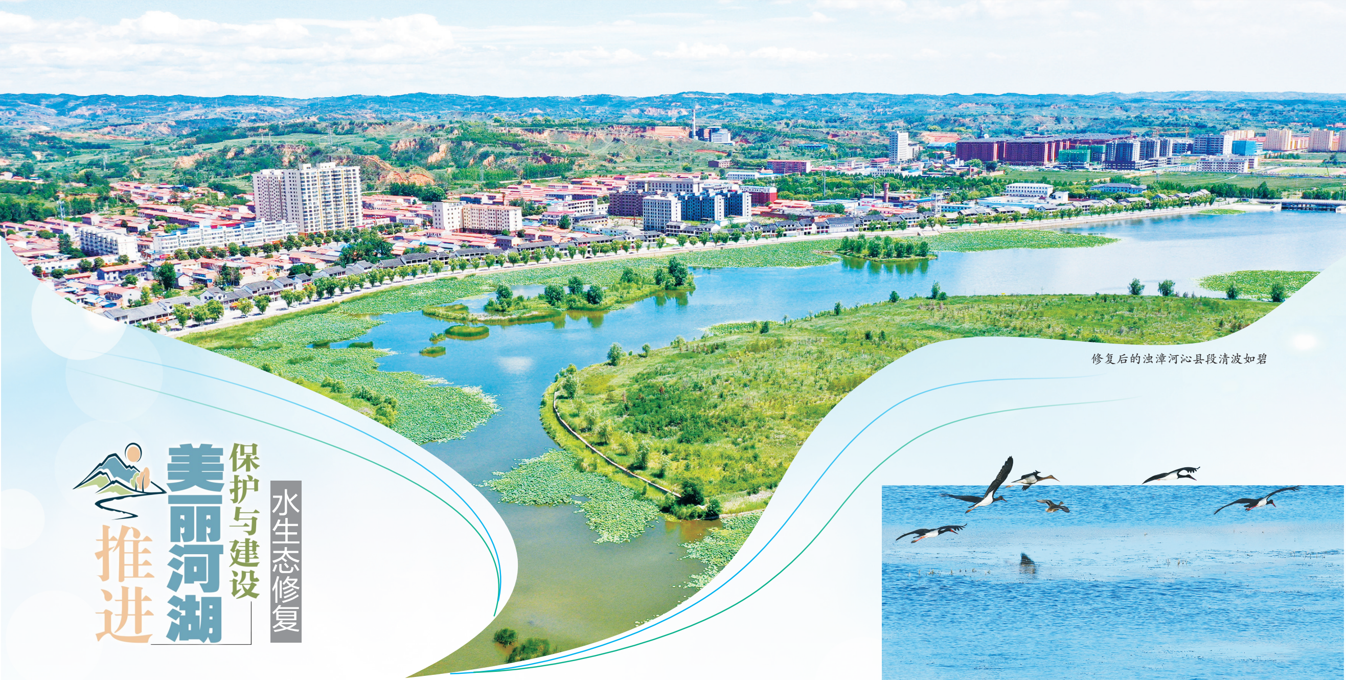
修复后的浊漳河沁县段清波如碧