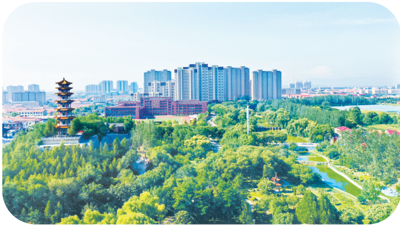
长子县绿意满城水韵人和