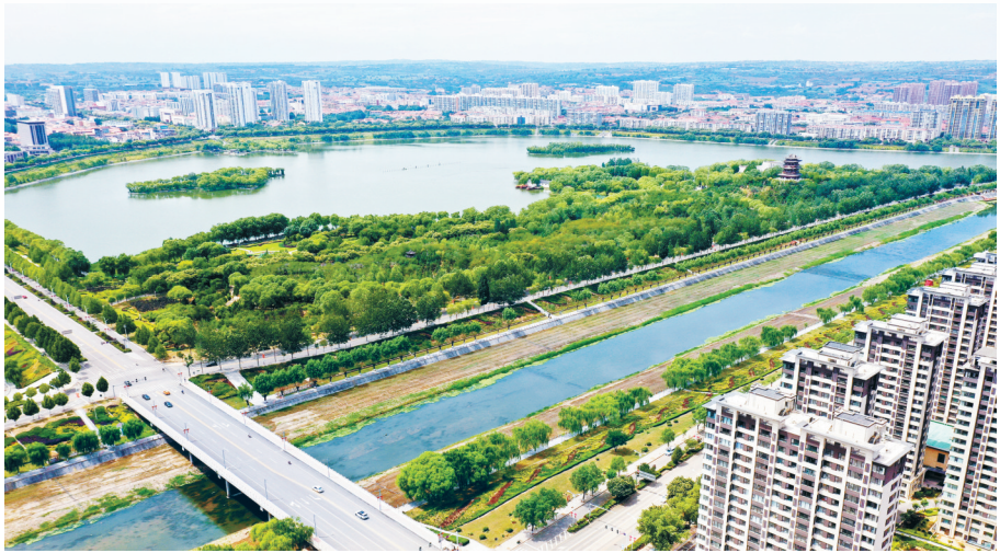
襄垣县水生态修复工程成效显著