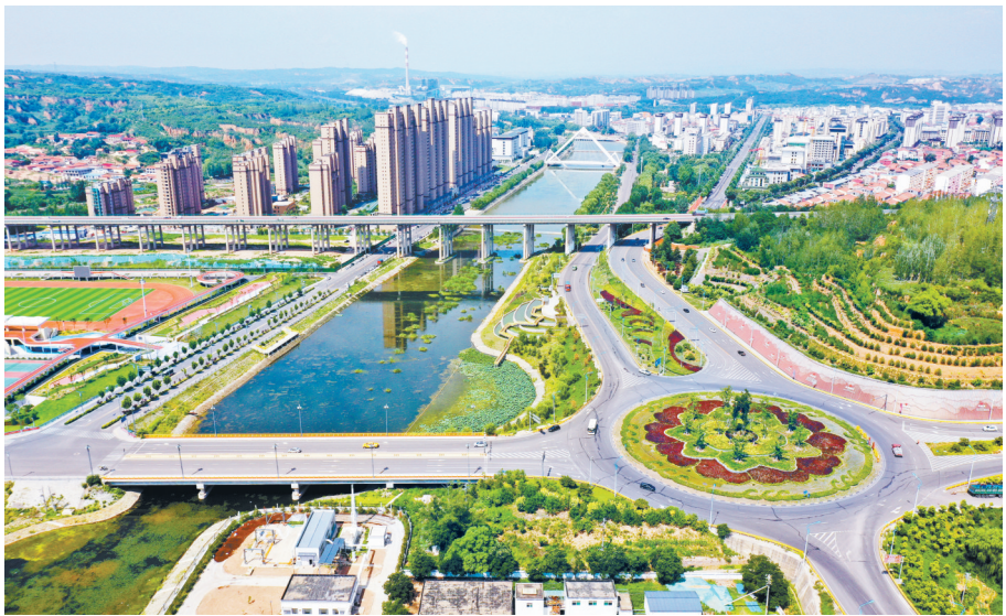
武乡县以河长制引领水生态治理