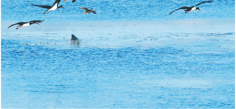
漳泽湖国家城市湿地公园呈现出一派生机勃勃的自然画卷