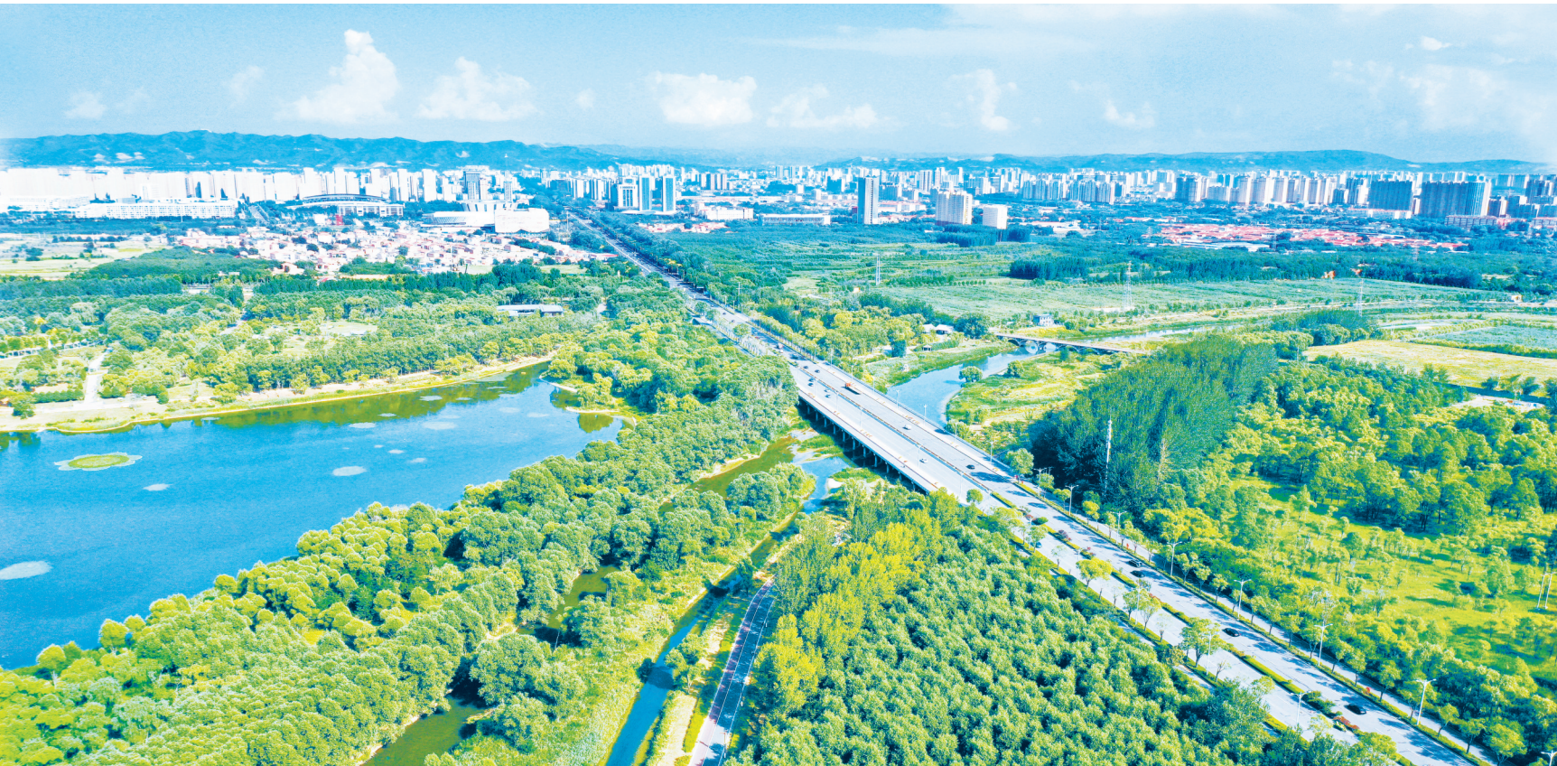
我市持续推进生态工程,让绿色成为城市发展亮丽底色