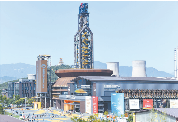
图为北京首钢园2025年服贸会展馆外景。9月14日，2025年中国国际服务贸易交易会在北京落下帷幕。