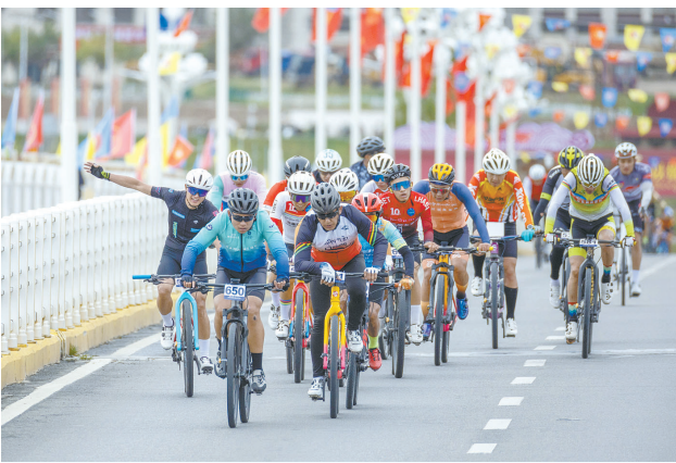
9月14日，选手们在比赛中穿过跨越拉萨河的迎亲桥。

在供给侧，以技术创新激发潜在消费需求，以标准升级引领产品质量提升，保障产业链供应链稳定，加快汽车行业数字化、智能化转型。要求加快突破汽车芯片、操作系统、人工智能、固态电池等关键技术，持续提升产品经济性、耐久性、舒适性等性能等。