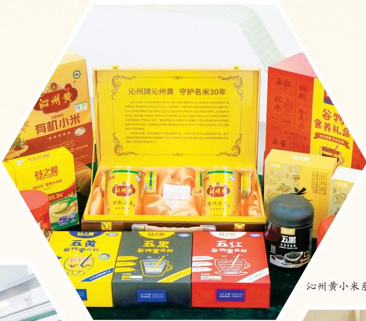
沁州黄小米系列产品