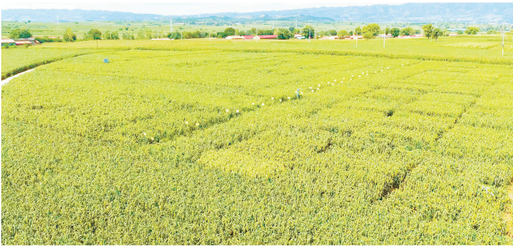
沁州黄小米种植基地