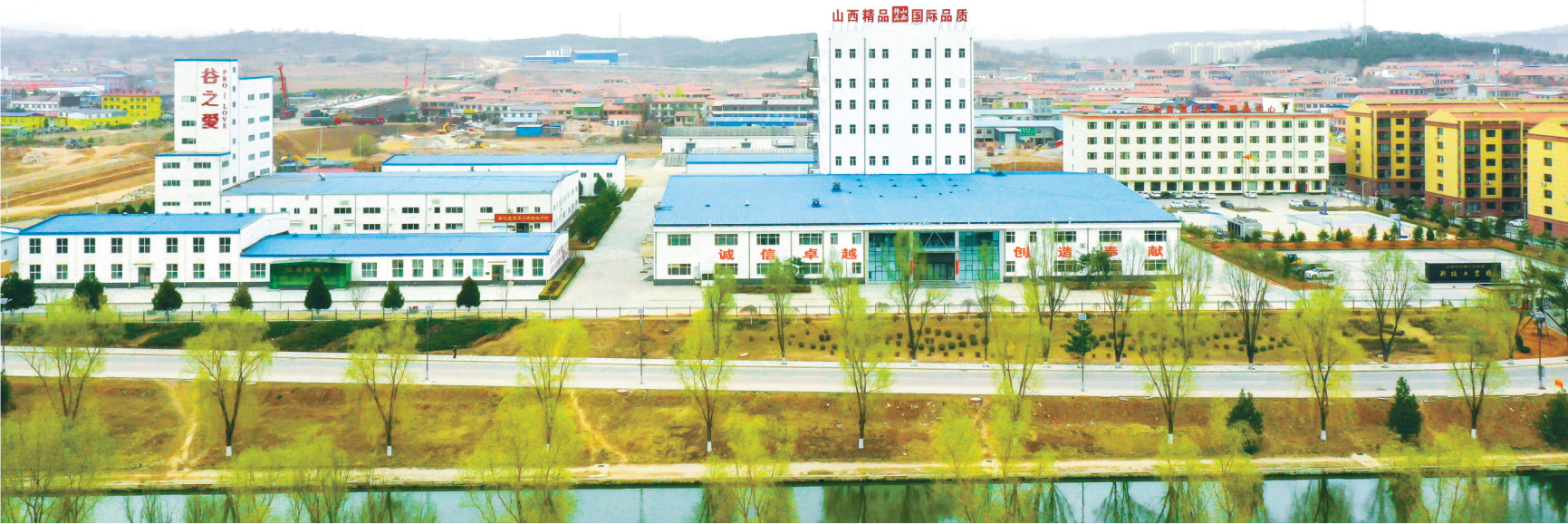
山西沁州黄小米(集团)有限公司

我们坚信，这颗承载着千年农耕文明的“黄金米”，必将长成富民强县的“黄金产业”，“沁州黄”的香必将飘进更多家庭，“一粒小米富一方百姓”的愿景终将照进太行山深处的这片热土，为全市小米产业振兴书写精彩的“沁县答卷”。