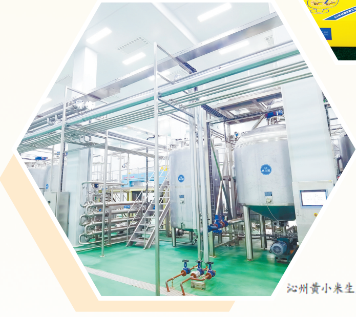
沁州黄小米生产车间