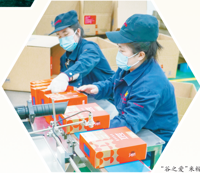
“谷之爱”米粉包装车间