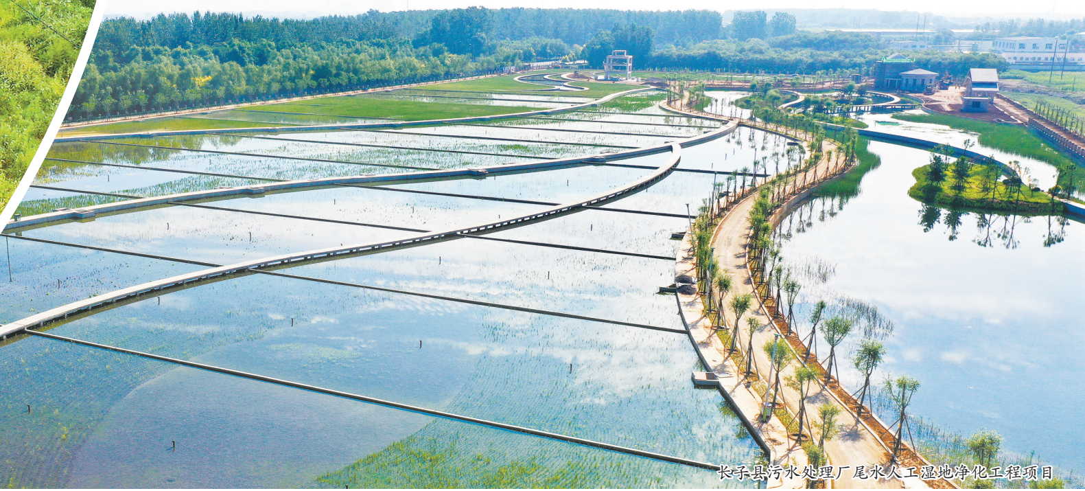
长子县污水处理厂尾水人工湿地净化工程项目