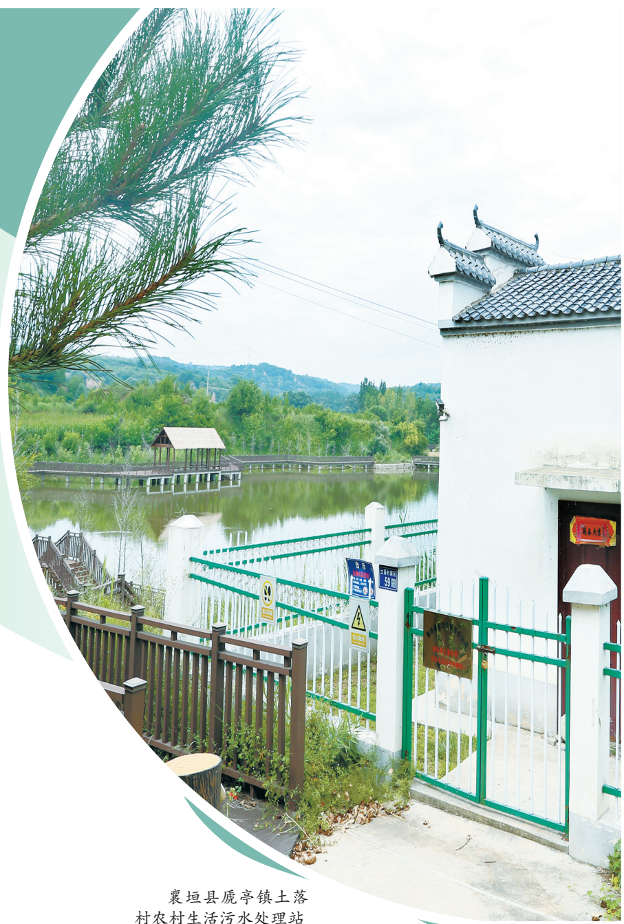
襄垣县鹿亭镇土落村农村生活污水处理站