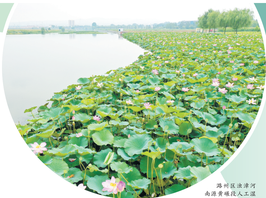
潞州区浊漳河南源黄碾段人工湿地水质净化工程