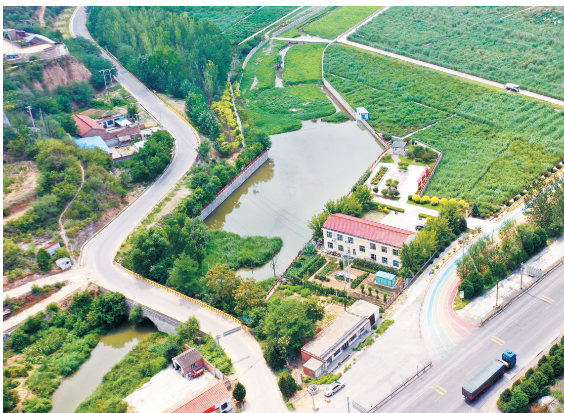
黎城县小东河河口人工湿地