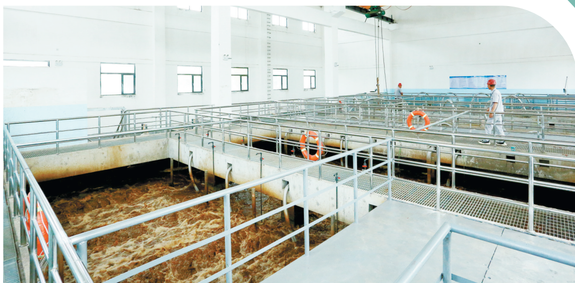
沁县第二污水处理厂