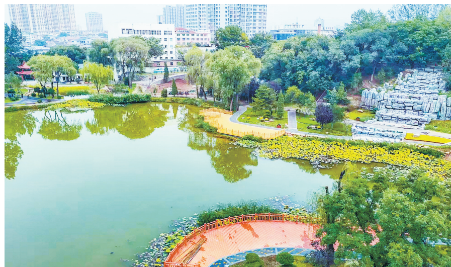
改造后的人民公园融入“山”“湖”“林”“娱”四大要素

城市，是人民的城市。从塑造宜居空间到涵养城市品质，从构建韧性体系到勾勒美丽风貌，长治正把城市发展的成果，转化为群众家门口的便利、日常生活里的幸福，稳步走向更加美好的未来。