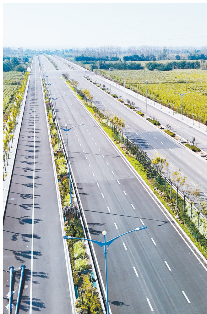
高新大道建设工程进一步优化城市路网结构