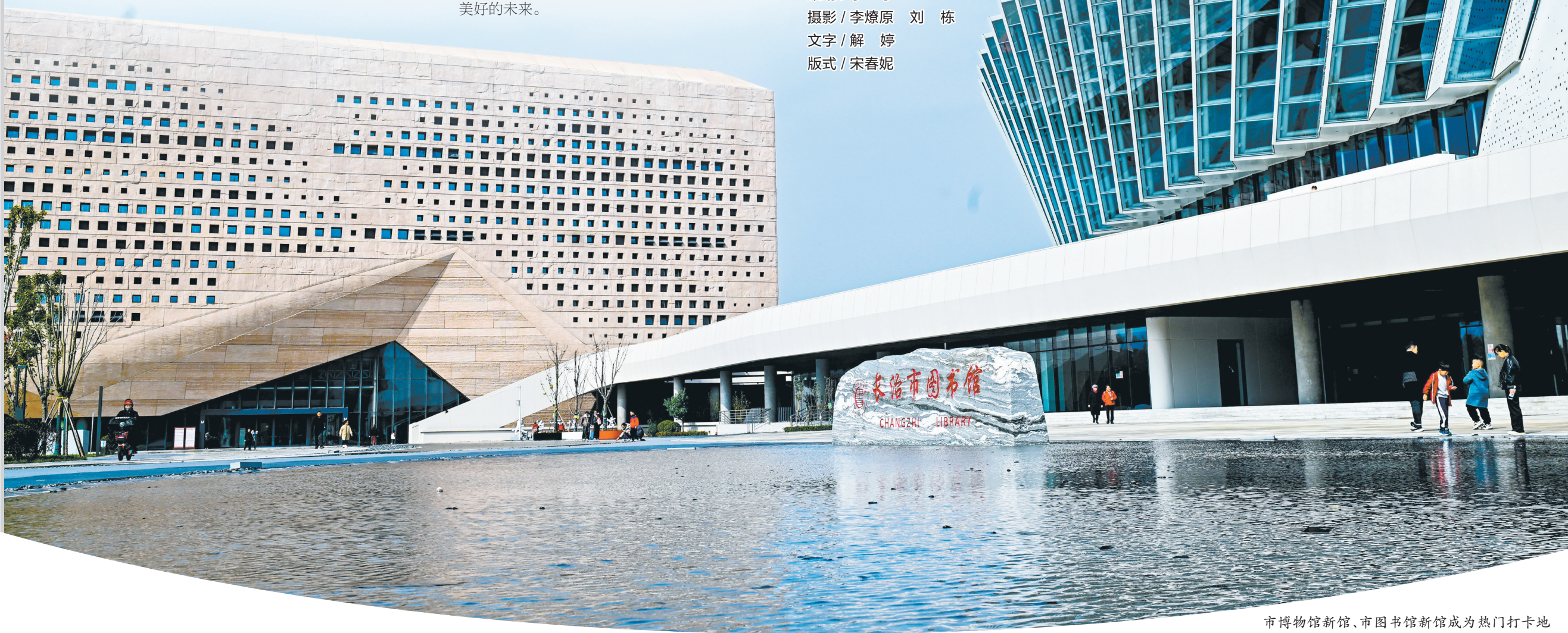
市博物馆新馆、市图书馆新馆成为热门打卡地