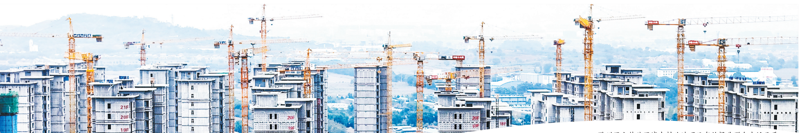
潞州区上韩片区城中村改造项目有效提升群众生活品质