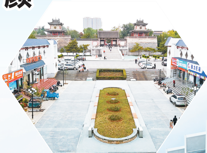
上党门步行街面貌一新