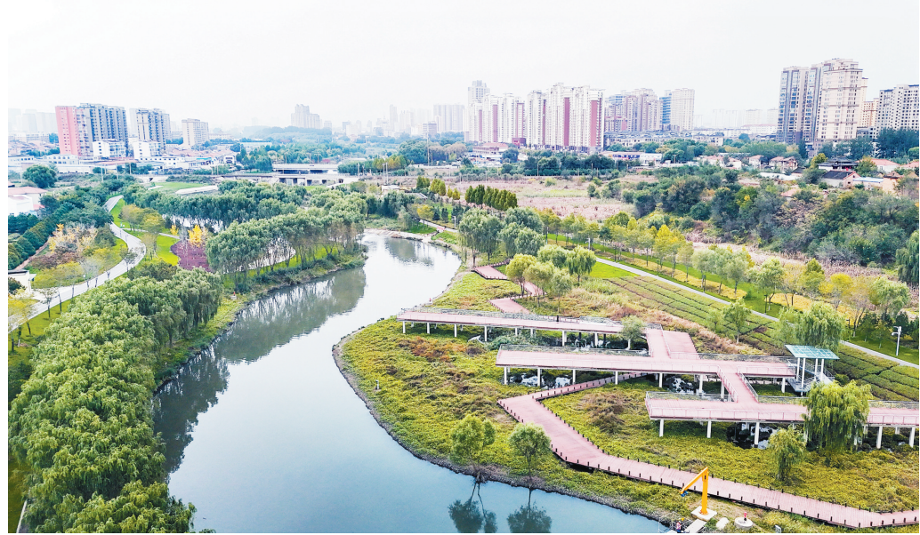
“三河一渠”生态治理与修复工程取得显著成效