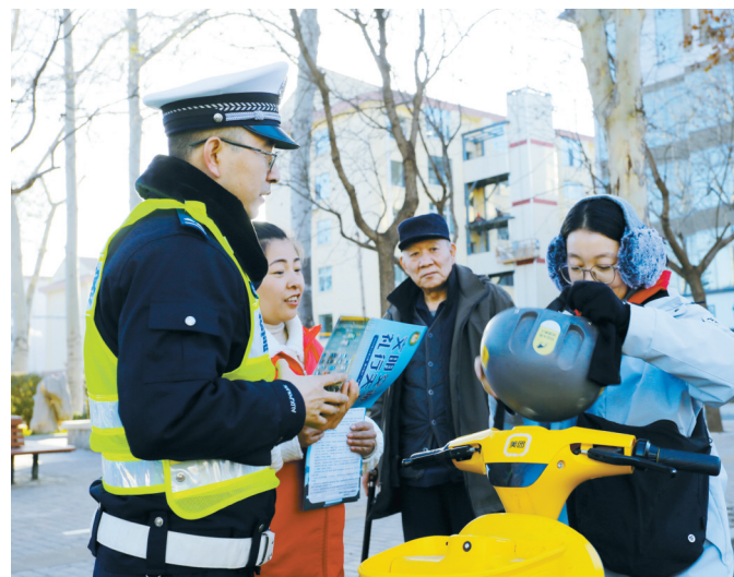
12月2日，潞州区太西街道广场西社区志愿者和交警三大队警务人员在广场西社区开展“122”交通安全宣传活动，向过往行人宣传交通安全常识。

此次演练有效锤炼了长治机场各部门协同作战和快速响应能力，进一步完善了全链条冬季除冰雪应急处置机制。长治机场相关负责人介绍，将持续强化冬季运行保障能力，不断优化应急处置预案，全力守护每一次航班安全起降，为广大旅客安全顺畅出行筑牢安全屏障。