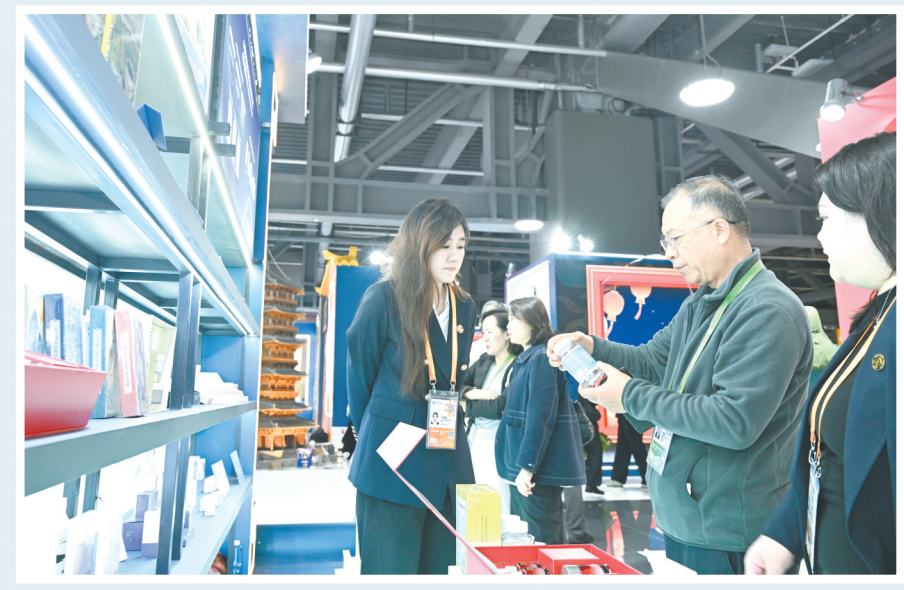
今年以来，我市积极组织优质企业赴专业展会平台对接资源，寻求合作，派出多支招商队伍，深入京津冀、长三角、粤港澳大湾区、成渝地区双城经济圈等重点区域，开展精准招商，为全市高质量发展引入源头活水。

深冬之际，浊漳两岸，招商热潮奔涌。 一支支招商铁军激情迸发、几度出征，一批批重点项目签约落地、加快建设，一个个产业集群优势互补、成型成势。 “十四五”收官之年，长治以“求其上”的姿态，狠抓招商引资“一号工程”，大力推进专业招商、产业链招商、精准招商。1—11月，全市共签