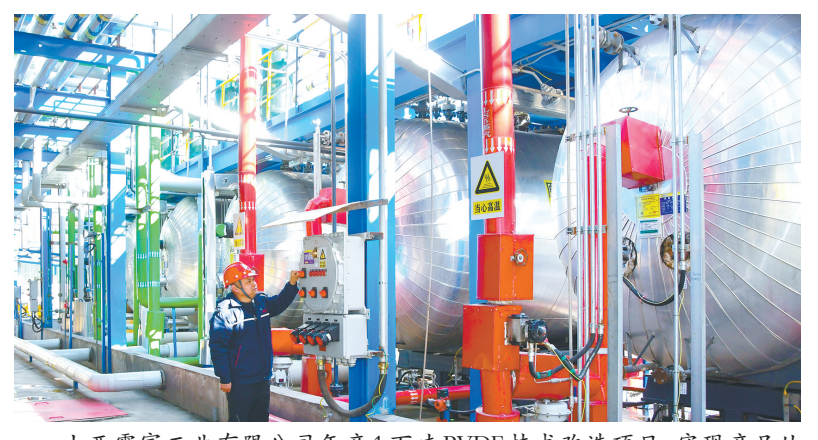
山西霍家工业有限公司年产1万吨PVDF技术改造项目，实现产品从传统PVC树脂向新能源、新材料精细化工转型升级。