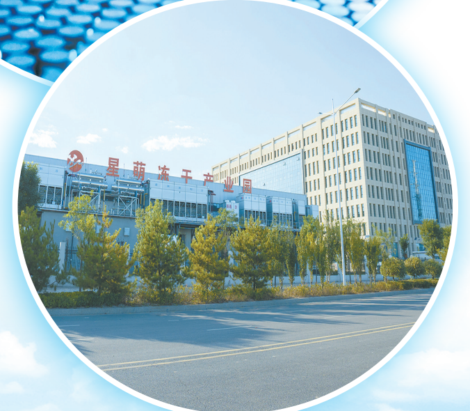
长子县冻干食品产业园锻造种养循环、农工贸一体、一二三产业融合的全产业链条，促进农业高质量发展。