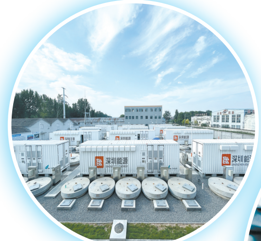
鼎轮能源科技(山西)有限公司30MW飞轮储能项目，将有效提升电网稳定性，是国内首座电网侧独立调频飞轮储能电站。

抓项目、促发展，归根结底是为了让人民过上更好的日子。 今年以来，我市从群众最关心、最迫切、最现实的利益问题着手，以民生实事为依托，大力实施民生工程，将民生期盼转化为一个个落地生根的惠民项目，让群众实实在在享受发展红利。 一项项重大项目落地，不仅积蓄着发展动能，更传递着可感可及的民生温度，让发展更有质感、幸福更有底色。 引项目焕新业态场景，丰富群众消费体验—— 潞州区锚定建设区域消费中心，精准布局多元消费场景，吾悦广场项目打造集购物中心、商业街、住宅于一体的城市综合体，建成后将成为主城区城南商业新地标，有效激活周边消费潜能；炉坊巷、锡坊巷等老街在改造中保留烟火气、串联起特色消费场景，让老街区焕发新活力。 长子县加速城市文旅商贸综合体项目建设，构建集文体运动、影塑研学、非遗体验、消费娱乐为一体的文旅商贸综合片区，持续提升城市消费品质。 壶关县欢乐海洋公园以三大剧场表演、自然野趣与梦幻场景为核心，年接待游客预计达30万人次。 遍布城乡的便民商业网点，让群众在“家门口”享受便捷服务，城市的温度在升腾的烟火气中愈发浓郁。 兴项目促进文旅融合，满足群众精神文化需求—— 武乡县深挖红色资源，升级八路军文化旅游景区基础设施，通过VR等技术活化“武乡顶灯”等非遗文化，全年开展120余场活动让红色文化可触可感。 观音堂公共文化创新体验基地建设正酣，项目规划的80个建筑单体中已有63个实现主体结构封顶，建成后将成为集教育、体验、休闲于一体的综合性文化实践平台。 壶关县云井青松岭研学基地融合生态、研学与康养，平顺县花椒小镇探索农文旅融合新路，漳泽湖国家城市湿地公园持续提升生态品质，满足群众对美好生活的向往。 总投资5.39亿元的后湾水库供水工程正式开工，建成后可实现从后湾水库引水入市，年供水量2100万立方米，对化解主城区单一水源供水风险、提高供水保障能力意义重大。 日益完善的基础设施，持续升级的公共服务，稳稳托起百姓的幸福生活。 夯基垒台，立柱架梁。2025年，长治以项目建设激活发展动能，夯实民生根基，为“十四五”圆满收官提供有力支撑。 “十五五”启幕在即，市委十二届九次全会锚定新航向，擘画新蓝图，再次传递大抓项目的鲜明导向与坚定决心。 长治奏响项目建设“更强音”！