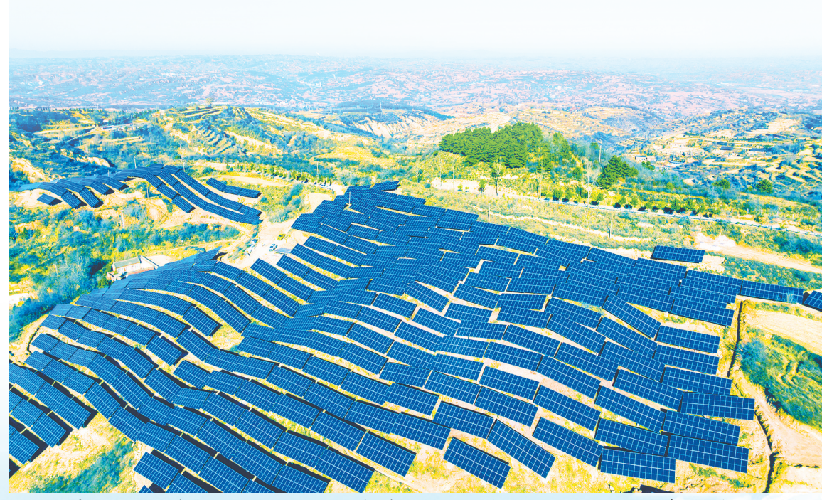
襄垣县“源网荷储”一体化项目加速推进，着力打造经济高效、供需协同、安全可靠的绿色用能洼地。

时下的长治寒意渐浓，但项目建设现场的热度却丝毫不减——机器轰鸣的车间，塔吊林立的工地，赶工忙碌的身影，处处涌动着争分夺秒的奋进气息。 长治经济技术开发区、山西高科视像科技有限公司MLED新型显示面板生产项目（二期）现场一派火热，建设者们正紧盯节点目标加紧施工。“这条生产线瞄准行业前沿，采用COB封装技术，显示间距可突破0.7mm，是国内率先实现该规格产品产业化的项目之一。”据项目负责人介绍，项目将有吸附上下游企业集聚，为长治电子信息产业体系嵌入高附加值“芯片”。 一个项目，就是一个新的增长点；一批项目，就是一个新的增长极。 深潜“抓项目就是抓发展”，长治正以项目为笔，在建链延链补链强链的画卷上浓墨重彩，推动新增长极加速培育，产业聚链成势不断加速。一批又一批支撑作用明显、带动力强、效益显著的项目落地生根，换来发展动能的“枝繁叶茂”，让“满天繁星”的项目图景，成为高质量发展的生动注脚。 以项目为锚，推动能源绿色转型——山西霍家工业有限公司PVDF（聚偏氟乙烯）生产车间，自动化生产线有序运转，工人身着防护服在密闭环境下紧张作业。项目投运后，预计可实现年均利润7.2亿元，为新材料产业再添砝码； 作为全国首个采用浸没式液冷技术的煤矿储能项目，上党区雄山二矿“平急两用”智慧储能项目试运行，通过绿电改造技术创新，为煤矿用电上了“双保险”，预测每月还可节省电费2万余元； 襄垣“源网荷储”一体化项目5万千瓦光伏项目，以日均200余根的速度铺设，织就绿色能源网络。 以项目为擎，带动产业迭代升级——光益生物科技有限公司设计生产的全国首款补充维生素D的接触式紫外无创光疗椅顺利完成组装检测，即将发往全国各地。标志着我市在半导体光疗与健康产业融合发展上迈出创新一步； 潞城区全钒液流电池项目现场，300MW半自动电堆组装生产线高速运转，将有效破解风力与光伏发电“看天吃饭”问题； 山西中研磁电科技有限公司高性能软磁材料项目所产磁环可使变频空调能耗直降50%，占据全国两成市场份额； 山西鹏飞集团以新能源、氢能项目开发运营为抓手，在沁源县布局建设综合能源岛，打造集加油、加气、加氢、充电功能于一体的“多能互补”综合能源枢纽； 以项目为桥，拓展多元发展格局——山西正来制药GMP易地技改项目自动化生产线上，游党参口服液源源不断下线。项目一期正式投产后，可形成年处理中药材3000吨以上产能，推动本地药材从“卖原料”向“卖产品”跃升； 长子县山海传奇时空广场项目建设现场各作业面有序推进。项目建成后，将深度融合神话传说与主题游乐、情景商业、文旅教育等业态，将“神话之乡”转化为文旅IP，为文旅产业提质升级注入新活力； 武乡县绿农农牧科技有限公司整合饲料生产、生态养殖、屠宰加工、粪污资源化利用等环节，并带动关联企业构建肉制品产业“矩阵”，实现农业种植、养殖及农产品加工业一体化循环生产； …… 星罗棋布的建设现场传递出强烈的发展信心。 随着越来越多项目从“蓝图”变为“实景图”，从工地走向生产线，大项目“顶天立地”带动小项目“铺天盖地”，大中小项目协同发展的生动画卷，正推动长治现代化产业体系从“框架构建”加速迈向“筋骨丰满”。