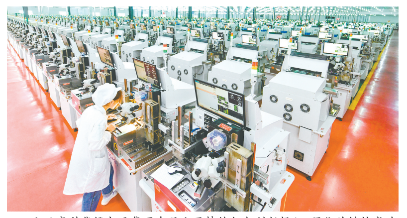
山西高科华烨电子集团有限公司持续加大创新投入，强化关键技术攻关，聚“链”成势，以龙头企业带动LED全产业链加速集聚。

编者按：岁末四眸，项目建设的热潮奔涌长治大地。2025年，我市紧扣“重大项目建设年”主线，以机制创新破题，用产业集群蓄势，以民生项目暖心，将一张张“项目蓝图”转化为高质量发展的“实景画卷”。 从省市重点工程的加速推进，到营商环境的持续优化，从能源转型的铿锵步伐，到民生福祉的稳步提升，长治以项目为媒，为资源型城市转型发展注入强劲动能。 站在“十四五”收官与“十五五”启幕的交汇点，这份亮眼的项目答卷，既是过往奋斗的缩影，更是未来前行的底气，必将引领长治在现代化建设新征程上再谱新篇。