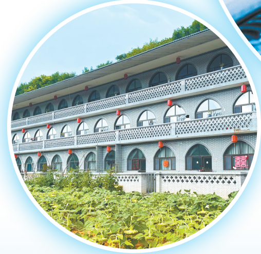
武乡县立足资源禀赋，以魏家窑村为样板发展民宿经济，为我市农文旅融合发展、推动城乡统筹建设提供了鲜活范例。