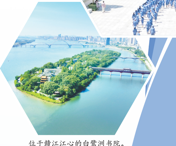
位于赣江江心的白鹭洲书院。