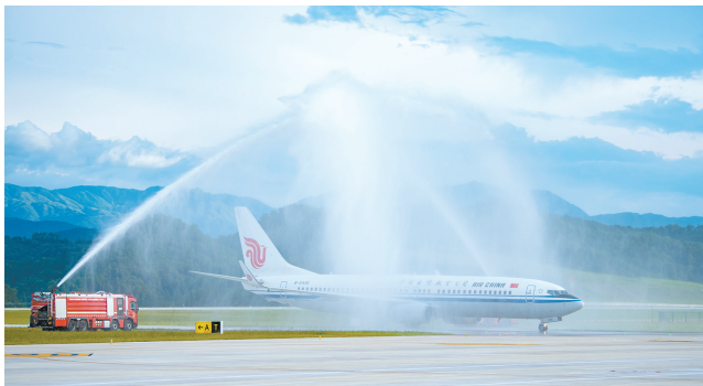
7月18日，由北京首都国际机场飞来的CA1873次航班降落在丽水机场，成为丽水机场的首个进港航班。当日，位于浙江省南部的丽水机场正式通航，并同步开通至北京首都国际机场、上海浦东国际机场的航线。由北京首都国际机场飞抵丽水的CA1873次航班成为丽水机场的首个进港航班。

据介绍，本次发现意味着我国铀矿勘查突破了砂岩型铀矿成矿理论禁区，在“天一空一地一深”三维探测技术基础上，集成建立了一套适合荒漠—沙漠覆盖区的砂岩型铀矿绿色高效探测技术体系，实现了新区、新层位、新类型、新深度找矿突破，对我国砂岩型铀矿找矿具有示范引领作用，将提升我国在荒漠—沙漠覆盖区铀资源勘查能力和水平。