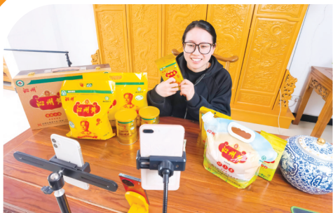
小米产品直播销售