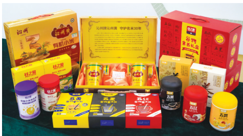
沁州黄小米系列产品