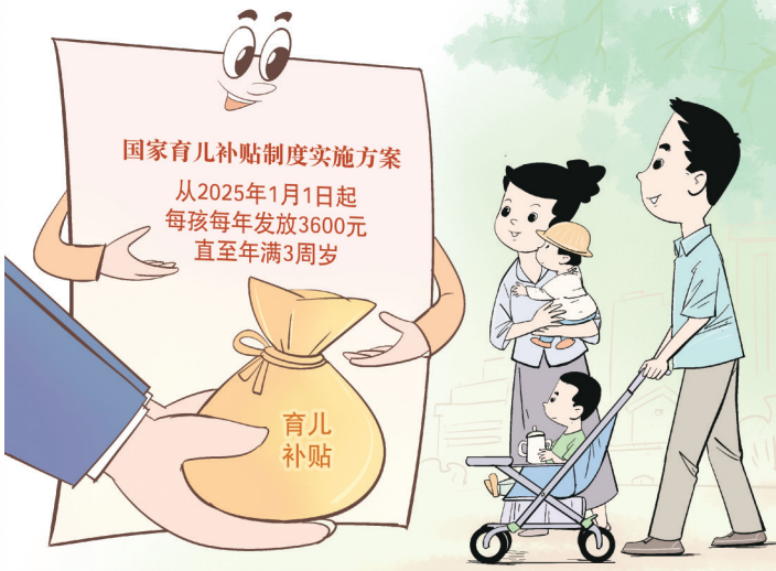
国家育儿补贴 勾建山 作

哪些家庭可以申领育儿补贴?补贴标准为何如此设定?地方已有补贴政策怎样衔接?“新华视点”记者采访多位专家,对热点问题做出解读。