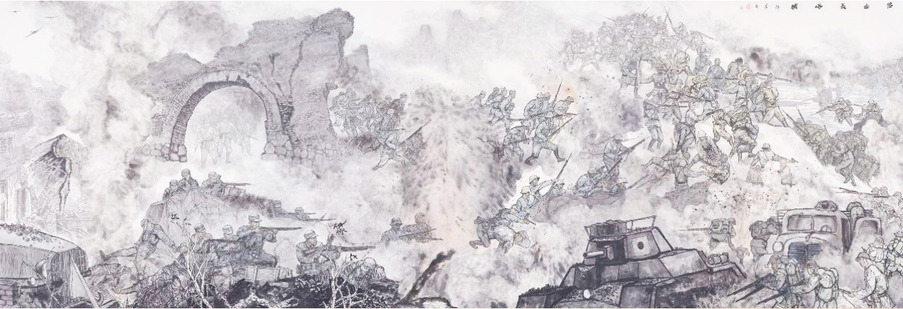
《浴血长沙城》韩清茂