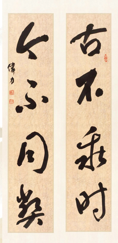
《古不乖时 今不同弊》崔伟力