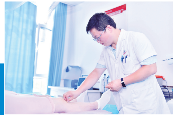
为患者进行针灸治疗。