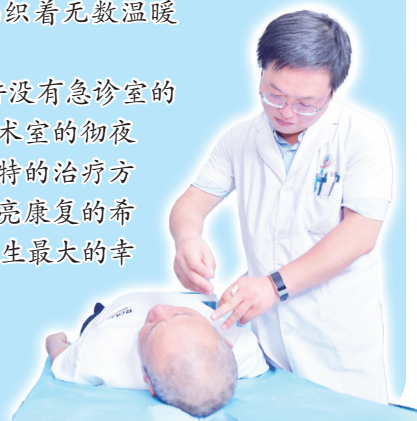
为患者做康复相关的检查。

康复医学科或许没有急诊室的争分夺秒，也没有手术室的彻夜坚守，但成庆忠用独特的治疗方法，为每一位患者点亮康复的希望。正如他所说：“医生最大的幸福，莫过于见证患者重获新生的笑容。”