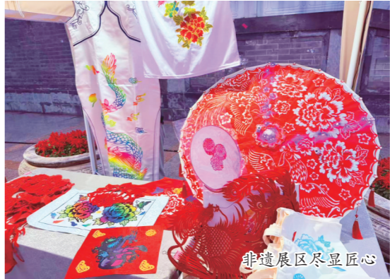
非遗展区尽显匠心

这场雨天里的文明实践集市，以“文艺+文明”的结对协作模式，生动诠释了“月满华诞映团圆 文明同辉倡新风”的理念。我市将持续以“我们的节日”为载体，深化“文明实践 结对同行”机制，推动文艺战线与基层实践站点常态化协作，让文艺力量持续赋能文明实践，让传统文化在传承中焕新，让文明新风融入市民生活。