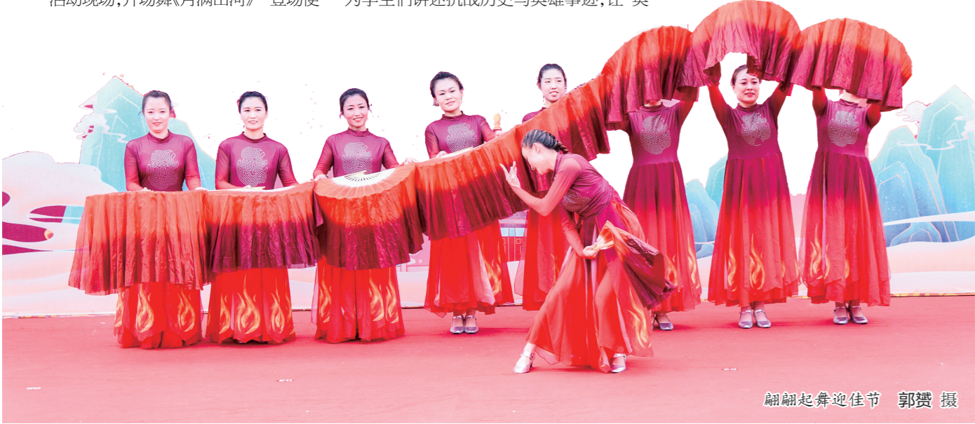
翩翩起舞迎佳节