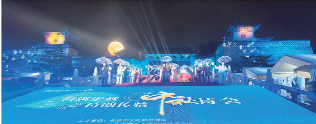
主办方：长治市文化和旅游局、长治市朗诵协会、长治市朗诵协会