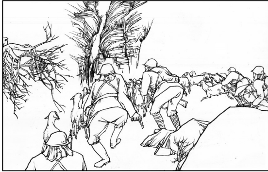
181. 跟在羊群后面的鬼子猫腰端枪，渐渐接近了瓮圪廊的石梯栈道。

这是一段抗日战争岁月的回眸，这是一轴风驰云动的历史画卷。为保卫太行山上的黄崖洞兵工厂，八路军与日寇展开了一场艰苦卓绝的斗争。故事中众多人物形象鲜明生动，展现出中华儿女以钢铁般的意志与侵略者殊死搏斗，在历史的丰碑上镌刻下可歌可泣的抗战壮歌。