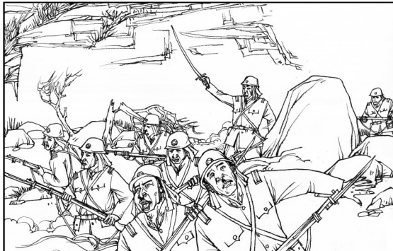
186. 一个面目狰狞的鬼子军官躲在一堆岩石后面，挥起一柄寒光闪闪的军刀，鬼子不要命地涌进瓮圪廊。