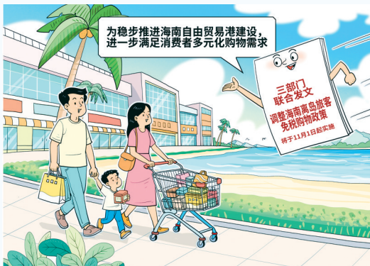
免税购物政策调整 朱慧卿 作

今年12月18日，海南自由贸易港将启动全岛封关运作，封关后离岛免税政策将继续实施。吴京芳表示，此次调整就是为推进更高水平的对外开放，更好满足旅客多元化购物需求，进一步释放离岛免税政策效应。