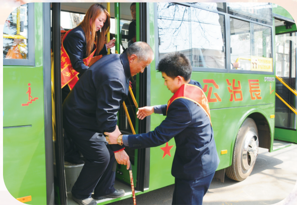
公交司乘人员帮扶老年乘客。

如今，温暖于这座城而言，早已跳出温度计的刻度，化作细腻关怀，浸润在城市生活的每一处褶皱里，流淌在市民日常生活的每一个瞬间。