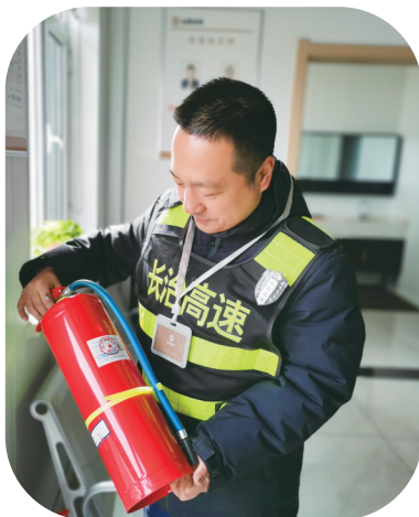
收费站工作人员开展安全隐患排查。