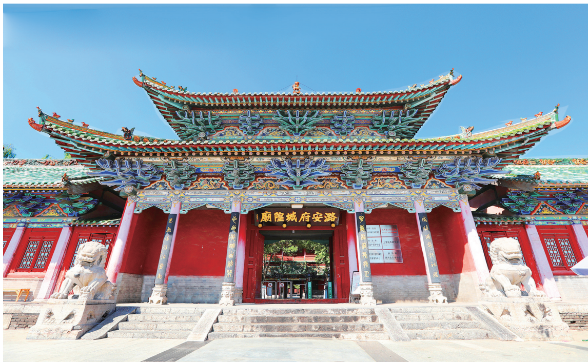
潞安府城隍庙外景 (资料图)